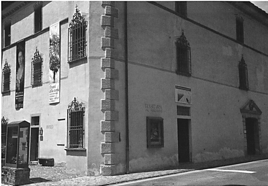
La Tessitura gestisce oggi un negozio al pianterreno e un laboratorio al primo piano del Palazzo De Bassus Mengotti