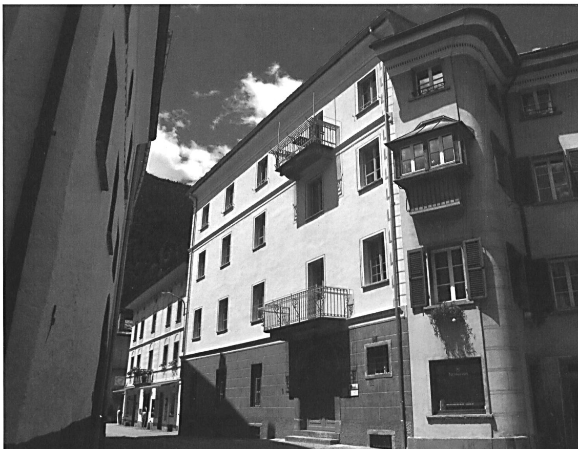
Casa Battaglia, ubicata in via San Giovanni e oggi riammodernata, prima sede del laboratorio della Tessitura