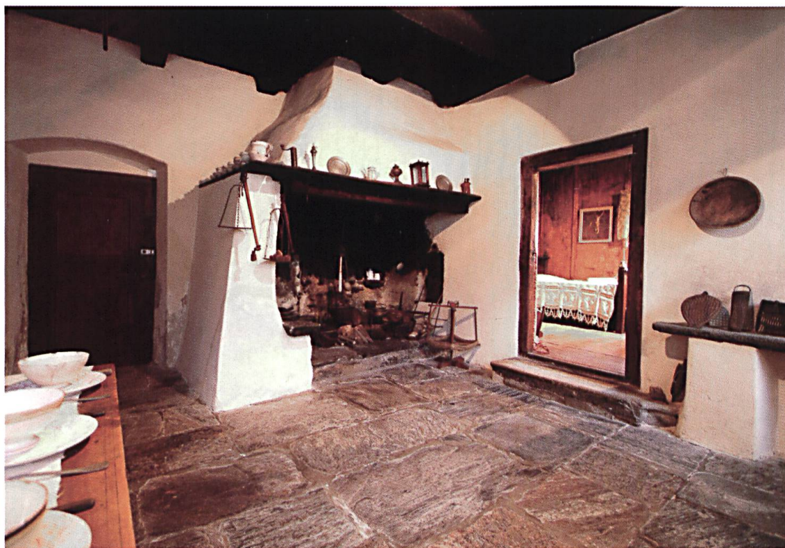
La tipica cucina mesolcinese.

stato possibile dare spazio nel museo anche a questo importante aspetto del nostro passato. La sezione archeologica, che oggi si presenta con una veste moderna, è arricchita da un laboratorio sperimentale-didattico che è stato in gran parte finanziato dall'Ufficio federale delle strade e da altri sostenitori.