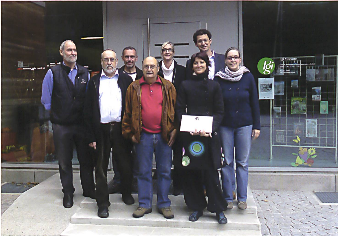
Il momento del “passaggio di consegne”

un coordinamento efficace, nonché per un potenziamento del servizio bibliotecario in Mesolcina e Calanca. Nel 1977, presso la Ca' Rossa di Grono, fu creata la “Biblioteca di studio” della sezione moesana della Pgi, che – congiuntamente alla Biblioteca popolare del Moesano con sede a Roveredo e al centro di distribuzione di Mesocco (concesso dalla Biblioteca popolare di Coira) – contribuì negli anni a stimolare e a rafforzare le attività di lettura nel tempo libero e le attività di ricerca degli studiosi. 9