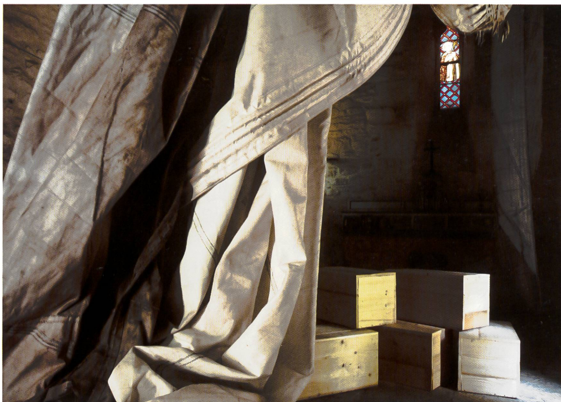
Vela, casse "rèductions" e filo di lana "Bleu horizon"