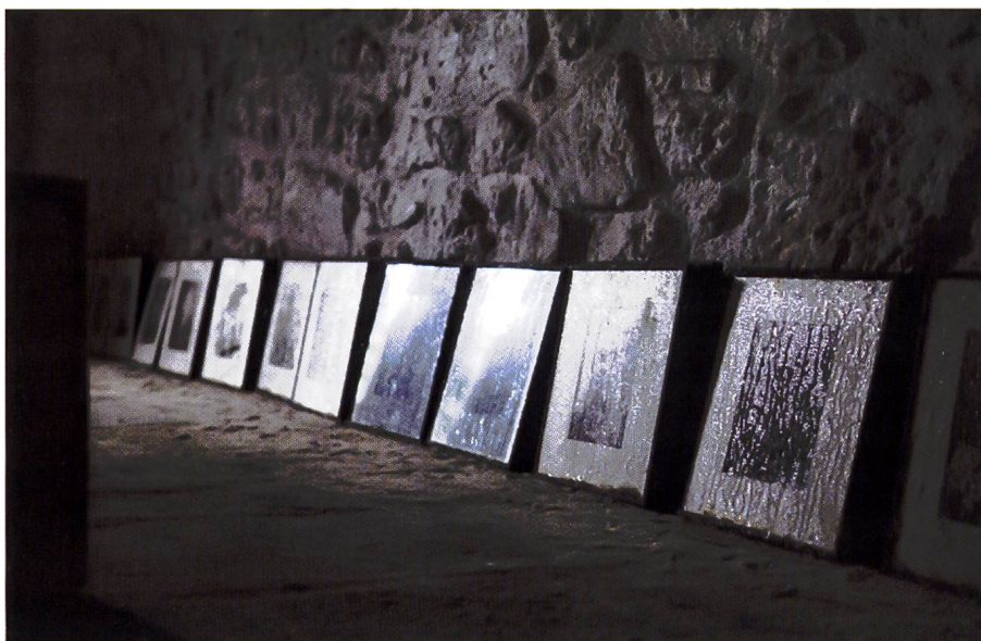
Ritratti posati sul pavimento della cappella su una fascia di sabbia presa in prestito dalla spiaggia vicina

I ritratti: come nel sogno tolgo i ritratti dalle casse e con le spalle al muro li poso su una fascia di sabbia lungo tutto il perimetro interno della cappella.