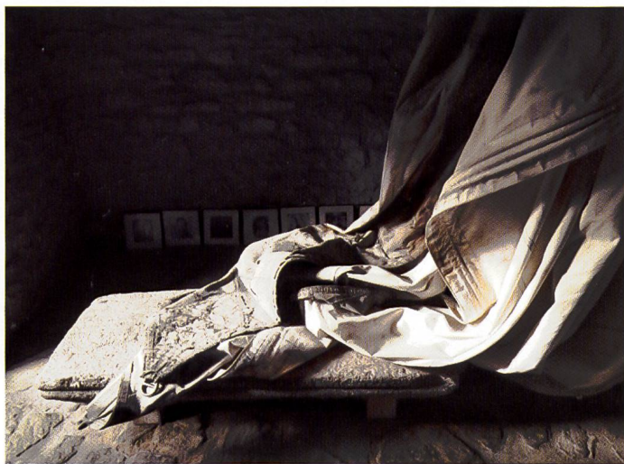
Pietra tombale, già in loco

A Landéda trovo una vela presso AJD. 3 In un angolo del tessuto c'è una scritta: «AGHATE/GE / très fatigué»; un genoa, molto affaticato. Sono risalito alle origini della vela e ho scoperto che la barca apparteneva a Pierre Guillaume. Era un ufficiale della Marina e figlio di un ufficiale della Prima guerra mondiale, chef de bataillon dans l'infanterie . Come un marinaio piego la vela di 14 metri longitudinalmente su sé stessa. La parte