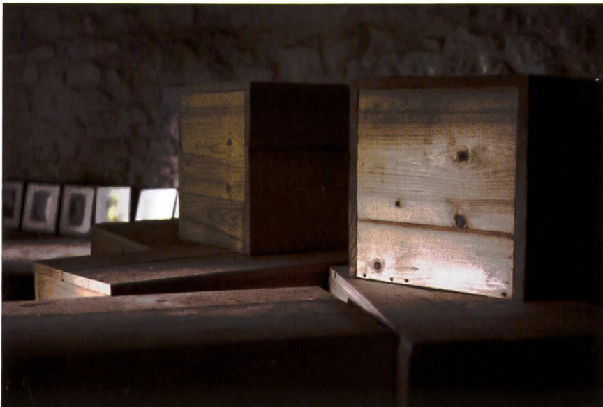
"Réductions" eseguite da un falegname di Verdun

Le " réductions " sono le casse che associo a quelle utilizzate per il rientro al paese d'origine delle salme o, meglio, a ciò che ne è rimasto. Solo pochissimi soldati hanno avuto il privilegio di essere risepelliti nella loro terra d'origine. Alla fine della guerra il rimpatrio avveniva illegalmente tramite i cosiddetti " mercantis de la mort "; solo più tardi i corpi furono esumati e rimpatriati con il consenso e l'aiuto dello stato.