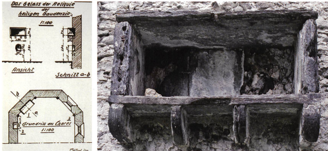
Particolare del coro con la nicchia sepolcrale disegnata da P. Dalbert nel 1927 (a sinistra) La nicchia sepolcrale allo stato attuale (a destra)