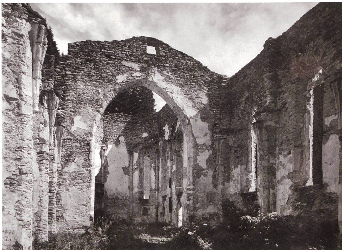
Lo stato della rovina di San Gaudenzio prima del 1924