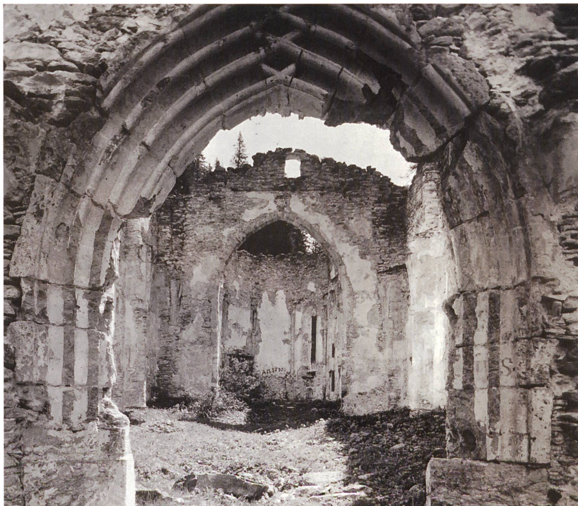
Lo stato della rovina di San Gaudenzio prima del 1924

La costruzione del nuovo santuario di pellegrinaggio in Bregaglia cadde in un momento in cui in Europa già si manifestavano i sintomi del conflitto da cui avrebbe poi originato la scissione confessionale. La fisionomia tardogotica dell'edificio documenta l'impegno religioso di una collettività insediata nella parte alta di una valle sudalpina grigione tradizionalmente orientata verso nord. Pochi decenni dopo l'inaugurazione, la struttura, ormai in esubero per i culti riformati delle comunità locali, subì un progressivo abbandono. Concepito in parallelo con il transito commerciale, con il passaggio reiterato dei mercenari e con quello settimanale dei corrieri, il sito religioso con la nuova chiesa e l'antico ospizio, promossi a beneficio dei flussi pellegrinali, cessò assai presto la sua attività. Prevalse la professione della fede evangelica.