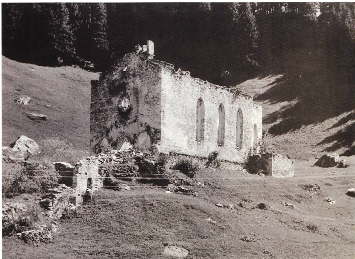
Lo stato della rovina di San Gaudenzio prima del 1924