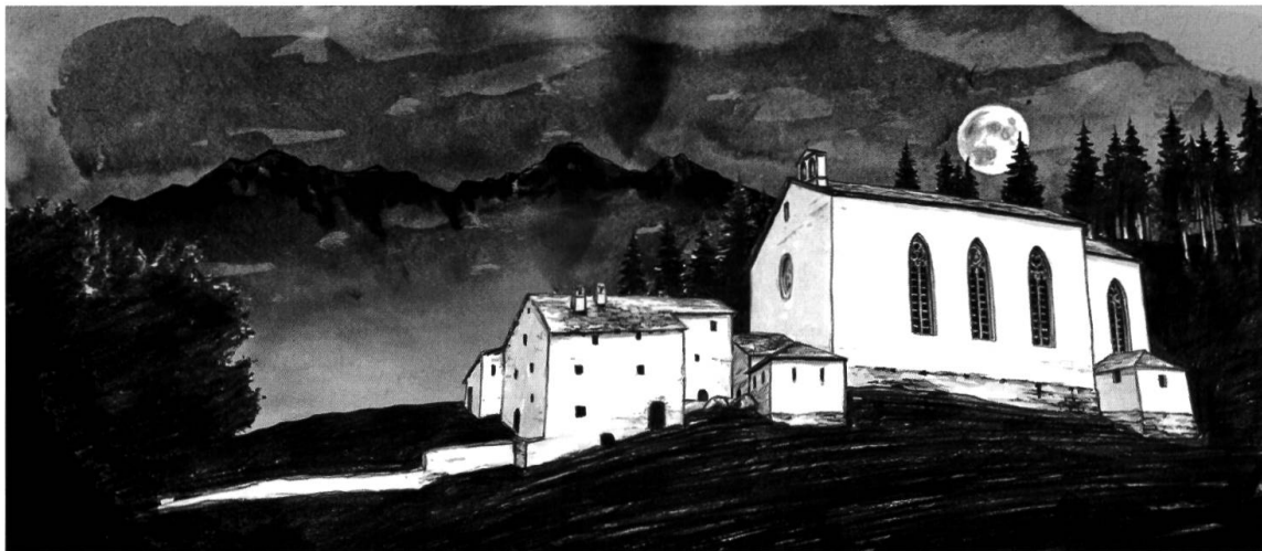
L'ospizio e la chiesa con ossario e sagrestia completamente a destra nel 1518 (ill. Jon Bischoff)

Nel 1515, in vista della demolizione della chiesa medioevale, il vescovo di Coira autorizzò la dislocazione delle reliquie del martire Gaudenzio. 43 L'atto di consacrazione del nuovo tempio è datato 13 maggio 1518 44 e include i seguenti cinque altari: Tutti gli Apostoli , Santa Croce , San Sebastiano , Tutti i Santi e l'altare maggiore di San Gaudenzio . La totale sostituzione dell'antica chiesa con un tempio nuovo è confermata cinque anni più tardi in una lettera al vescovo di Coira Paul Ziegler, 45 e il documento accenna pure al preesistente ospizio posto di fronte alla chiesa.