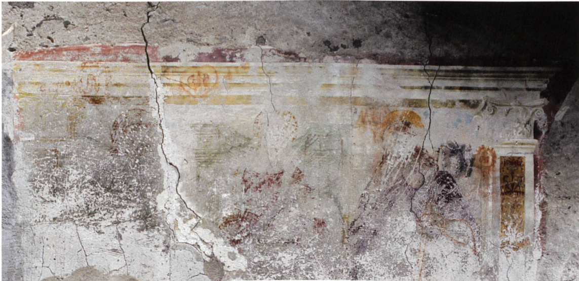
L'affresco sulla destra della facciata della casa patrizia n. 5-17 di Casaccia, commissionato intorno al 1520