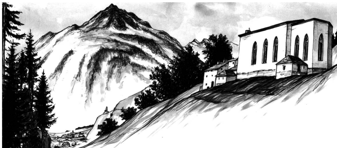
Ricostruzione del sito di San Gaudenzio con Casaccia sullo sfondo (ill. Jon Bischoff)

Nella chiesa nuova i pellegrini potevano venerare le reliquie di Gaudenzio, rinchiusi in una massiccia nicchia a muro formata da cinque grossi lastroni di pietra. Le lastre sorrette da mensole sporgevano dalla parete del coro all'inconsueta altezza di 2,8 metri da terra. I frammenti tuttora in loco, privi della lastra frontale, misurano 150 cm in lunghezza, 70 cm in altezza e 65 cm in profondità; il fronte, forse apribile, era sprangato con guarnizioni di ferro. La nicchia era situata molto più in alto del tradizionale sacrario posto sulla sinistra: in funzione dei riti devozionali, il collocamento elevato del vistoso reliquiario, privo di sostegni da terra, presuppone un arredo sottostante, davanti al quale i pellegrini potessero sostare in raccoglimento prima di gettare il loro obolo in moneta.