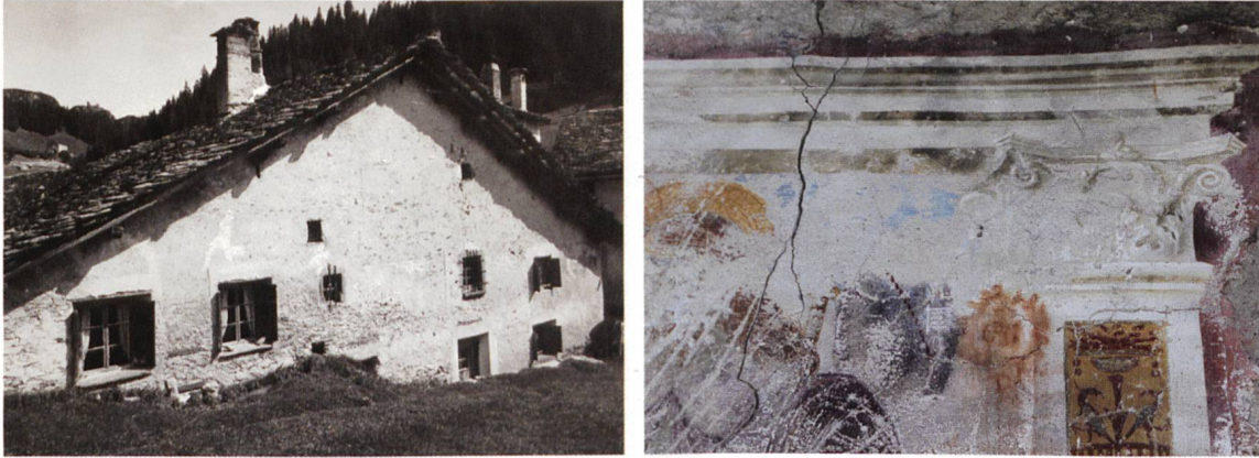
Fotografia storica (s.d.) della facciata con l'affresco cinquecentesco sulla casa patrizia n. 5-17 a Casaccia. Sulla facciata sono presenti tre rettangoli affrescati (a sinistra). Un particolare dell'affresco sciupato. I pilastri sono ornati a grottesca con racemi e uccelli (a destra).