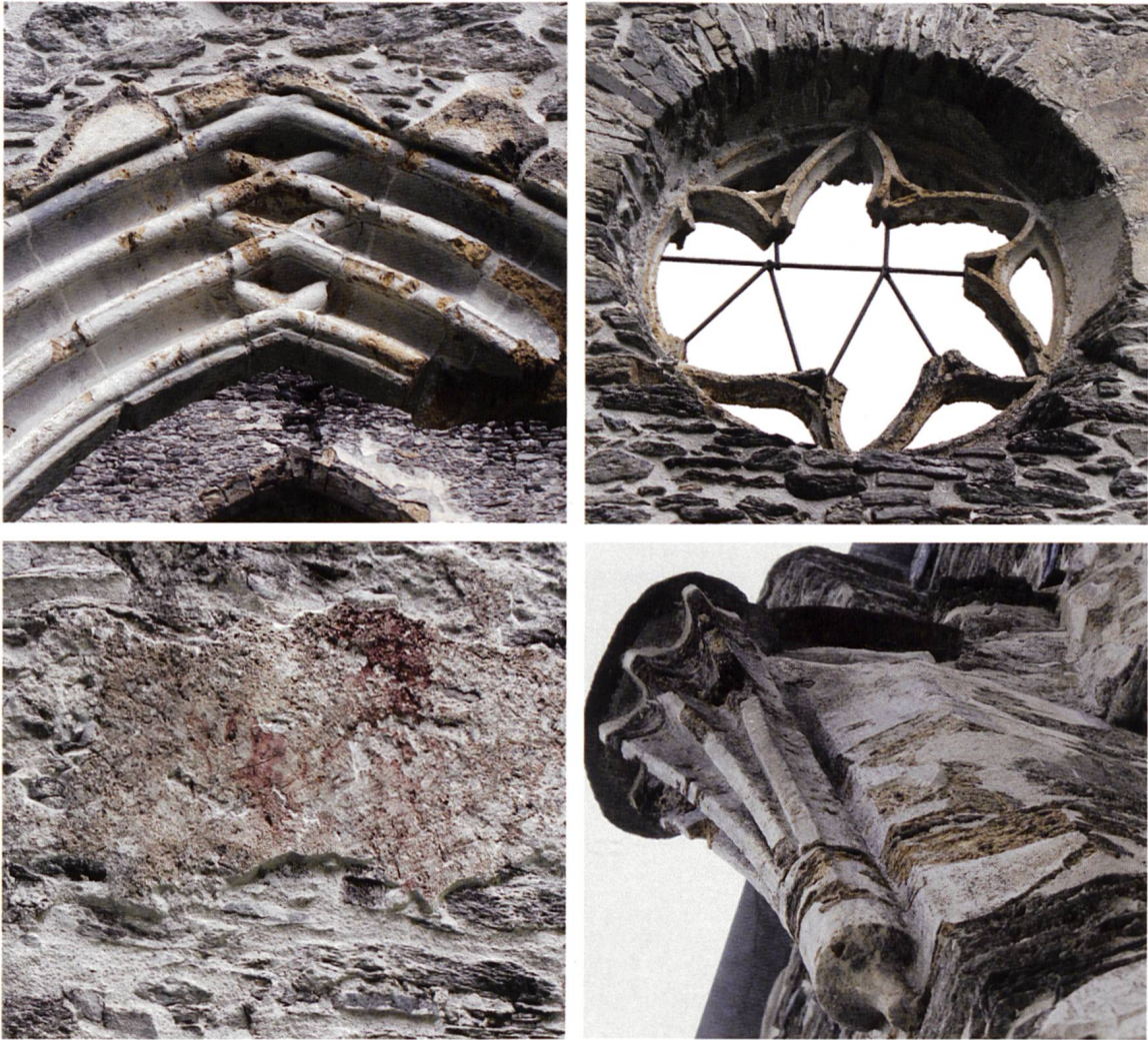
Dall'alto a sinistra: il tufo calcareo dell'arco acuto del portale era velato con calce in tinte grigie; resti del rosone in tufo calcareo; lacerti di un presunto san Cristoforo, affrescato sulla spalla esterna della navata; frammento delle nervature alla radice della volta protette da lastre di pietra.