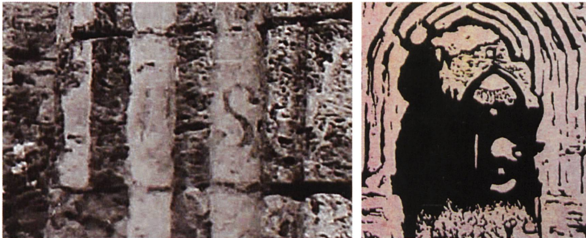
Sulla cornice del portale alcuni decenni fa erano leggibili le lettere IHS (Jesus Hominum Salvator), scritte dopo il 1518 (a sinistra)