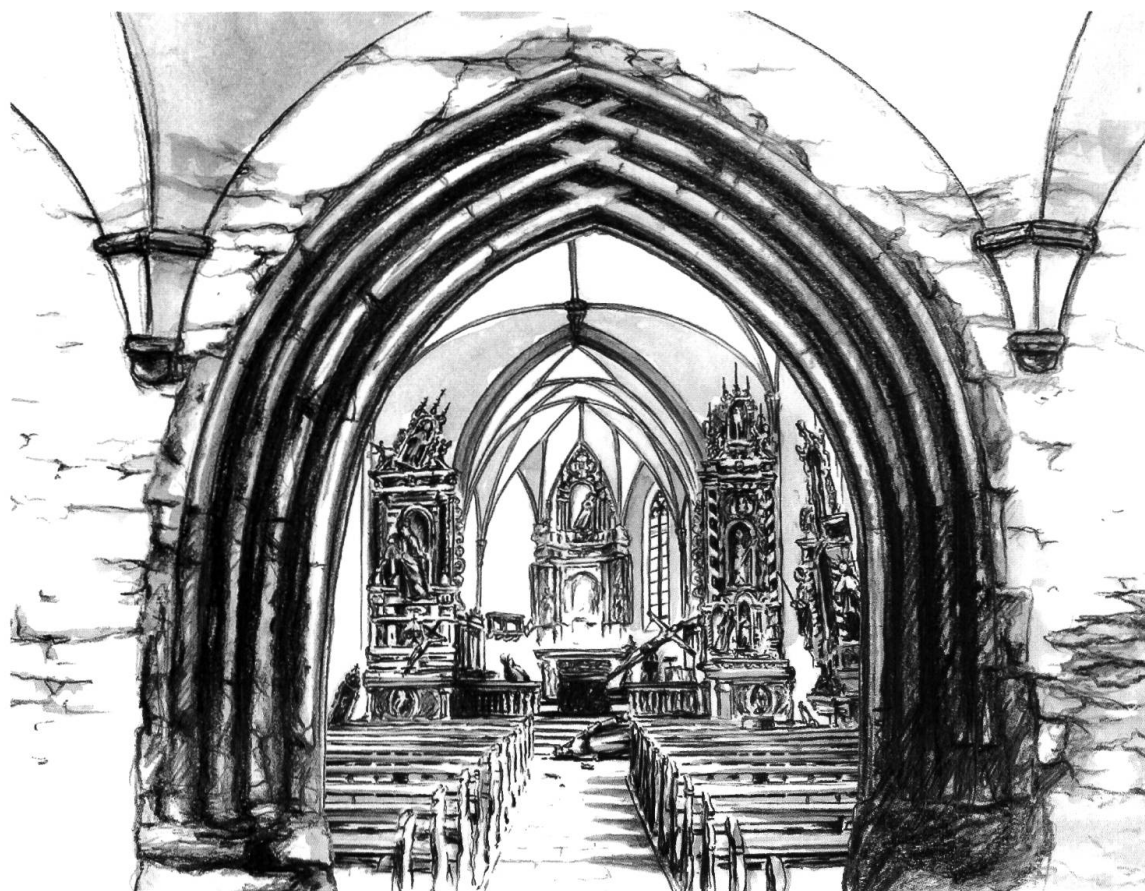
Interno della chiesa immediatamente dopo la profanazione del 1551 (ill. Jon Bischoff)

Nel 2017, in occasione dei 500 anni della Riforma, la RTR ha messo in onda un servizio basato sulla ricostruzione grafica dell'atto vandalico del 1551. L'illustrazione qui riprodotta rende efficacemente l'architettura tardogotica coniugata a un scenografico arredo barocco per sottolineare la violenza devastatrice di quell'episodio. Il lettore è invitato a sottrarre l'opulenza barocca e a sostituirla con la spoglia atmosfera tardogotica: pareti bianche non affrescate, altari in forma di semplici mense con ceri e quadri, panconi senza schienale.