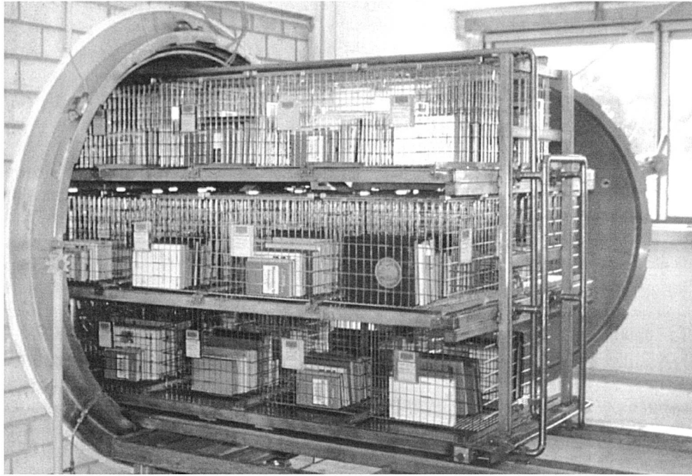
Introduction des documents. Chaque harasse métallique fait 0.5 m sur 6 m.

état physique pour être traités globalement. Il faut en effet éviter toute sélection par document qui serait beaucoup trop coûteuse.