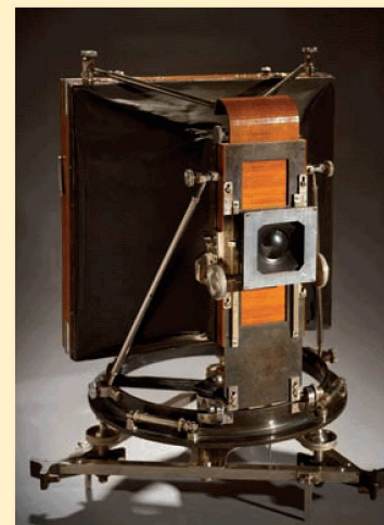
Caméra photogrammétrique Meydenbauer