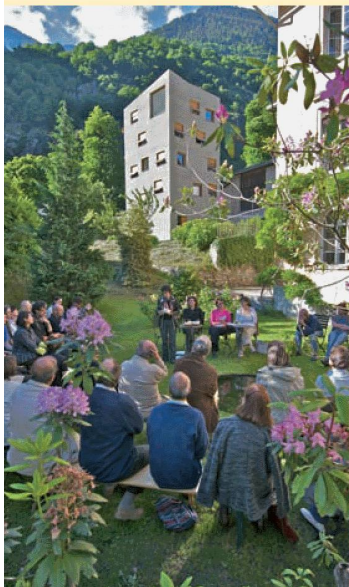
Vernissage du nouveau numéro de Quarto : Bregaglia / Bergell

La poésie d'Andri Peer passe pour moderne, difficile et même, assez souvent, incompréhensible. Le but du colloque de Lavin était de montrer que cette poésie se nourrit aussi des traditions et qu'elle se prête à de multiples lectures. Cette manifestation était une coproduction du centre culturel La Vouta, du Fonds national suisse de la recherche scientifique, de l'Université de Zurich et des ALS.