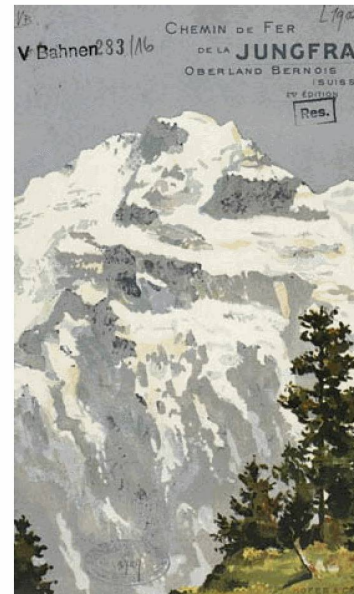
Exposition Reading Europe : Affiche des chemins de fer de la Jungfrau, 1903

Au Centre Dürrenmatt Neuchâtel, l'exposition Günter Grass – Bestiarium et les festivités marquant les 10 ans d'existence du centre ont eu un grand impact sur les chiffres de la fréquentation annuelle : 12 164 visiteurs contre 9784 en 2009. Les fêtes du 10 e anniversaire ont commencé le 25 septembre 2010 et vont se poursuivre pendant l'année 2011. 14