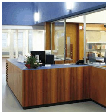
Les espaces ouverts au public après le réaménagement. Le guichet d'information

Il est désormais plus aisé d'accéder à certains fonds de la BN : les journaux sur microfilms peuvent être consultés sans qu'il y ait besoin de s'inscrire et de les commander, les collections de référence en histoire suisse, littératures suisses, art et architecture suisses et sciences de l'information ont été regroupées et étoffées.