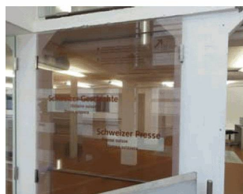
Les collections spécialisées