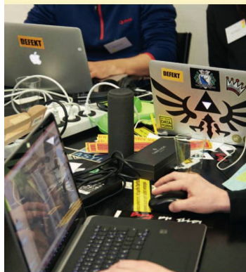
Hackathon culturel, 27–28.2.2015