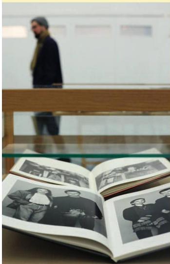
Le livre de photographie et ses auteurs, 28.11.2015–13.2.2016

Après l'exposition de 2014, Unikat – Unicum , la nouvelle exposition du Cabinet des estampes, Le livre de photographie et ses auteurs , était dédiée à une autre forme de livres d'artistes. Elle a présenté des livres de photographie d'auteurs, de photographes ou d'éditeurs suisses publiés à partir de 1990. Le 27 novembre, un colloque a réuni des chercheurs et des praticiens qui se sont entretenus sur le même sujet. Comme l'année précédente, l'exposition et le colloque s'inscrivaient dans le cadre du projet de recherche «Les artistes et les livres (1880–2015). La Suisse comme plateforme culturelle», financé par le Fonds national suisse de la recherche scientifique (FNS).