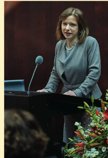
Christa Markwalder, vice-présidente du Conseil national, ouvre l'Assemblée générale de la CENL, 18.5.2015