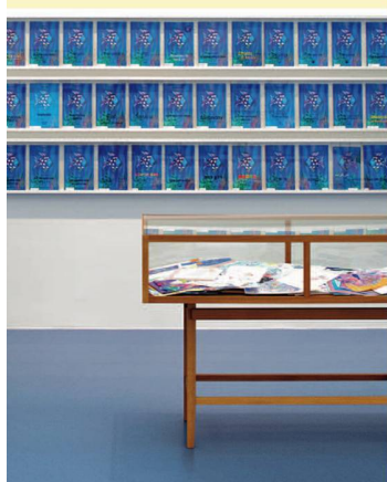
Le poisson arc-en-ciel , exposition sur le livre de Marcus Pfister, 20.3–27.6.2015

Jusqu'à 22 heures, les enfants ont été les rois de la nuit des musées 2015. Le concert de rock pour enfants du groupe Schtärneföif , donné à la salle de lecture, a été un moment particulièrement apprécié. Dans un «salon de coiffure» d'exception, les petits ont pu se faire piquer des poissons dans les cheveux, en écho au thème de l'exposition, Le poisson arc-en-ciel . Dans le cadre de l'exposition, des enfants ont lu des extraits dans onze langues différentes du livre mondialement connu de Marcus Pfister. A partir de 22 heures, les adultes ont pu se détendre au Bistrot de la BN en écoutant un concert du Hot Club de Berne . Après la nuit des musées, l'exposition Le poisson arc-en-ciel est restée ouverte jusqu'au 27.6.2015.