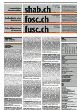
Feuille officielle suisse du commerce, 1 (2014)