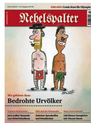
Nebelspalter, 1 (2010)

Les ALS ont publié en 2016 un numéro de leur revue Quarto 18 et le CDN quatre numéros des Cahiers du CDN 19 . Les deux derniers Cahiers du CDN , les numéros 13 et 14, se rapportent à deux expositions du Centre, Ionesco - Dürrenmatt. Peinture et théâtre et Jean-Christophe Norman - Matières .