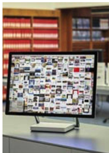
Archives web : écran à la salle d'information

La collection générale de la BN s'est accrue de 1,2% en 2020. Elle comprenait à la fin de l'année 4 882 722 unités (4 826 802 en 2019). Cette croissance est inférieure à celle de l'année précédente (1,5% en 2019). Le recul s'explique par le fait que la pandémie a contraint plusieurs maisons d'édition à différer ou à réduire leurs programmes. La collection se compose de publications analogiques et nées numériques et compte 3,13 millions de monographies (essais, romans, manuels, biographies et autres) et un peu plus de 1 million de revues. S'y ajoutent d'autres formes d'imprimés comme les partitions musicales, les cartes de géographie, microformes, etc. La croissance de la collection des publications nées numériques a été à nouveau au-dessus de la moyenne (plus 22%) et comprenait à la fin de 2020 1 823 335 paquets d'archives (1 497 26 en 2019). La bibliothèque de l'EPF Zurich y a contribué en fournissant l'ensemble des thèses électroniques parues depuis 2008. En outre, les restrictions dues à la pandémie n'ont eu aucune influence sur ce genre de publications.