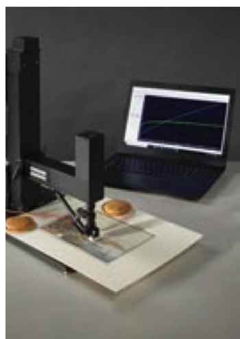
Micro Fading Testing permet de déterminer la durée d'exposition d'un objet.