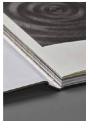
Reliure d'origine avec coutures apparentes

Les retards pris dans l'indexation de la collection générale l'année précédente, causés par le changement du système de gestion des bibliothèques, ont pu, en raison des interruptions liées à la pandémie, être stoppés, mais pas résorbés. Près de 10 000 œuvres attendent toujours d'être indexées à fin 2020. Le télétravail a permis de travailler intensivement à l'amélioration de la qualité des notices et de perfectionner notamment les points d'accès primaires (notices d'autorité) et de les adapter aux exigences de la Gemeinsame Normdatei (GND) internationale. Les travaux préparatoires à l'affichage des publications électroniques dans la bibliographie nationale Le Livre suisse sont terminés, de sorte que l'affichage correct a été réalisé dès le fascicule 2021/01. L'intégration automatisée de l'ancien catalogue Coris dans Helveticat en collaboration avec la Haute école spécialisée de Suisse occidentale HES-SO a bien avancé. Au vu des bons résultats, les travaux se poursuivront en 2021.