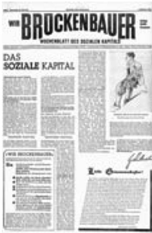
Wir Brückenbauer du 30.7.1942