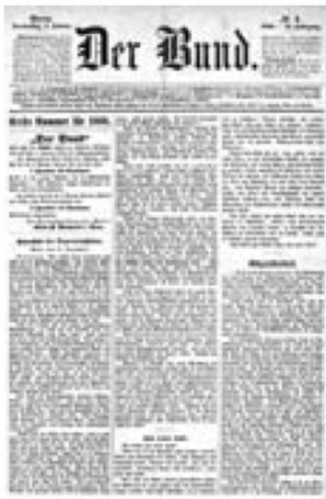
Der Bund du 2.1.1868

Pendant l'année sous rapport, ce ne sont pas moins de 1 726 492 pages de journaux qui ont été numérisées (641 349 en 2019). Cette augmentation substantielle provient du fait que des projets sont arrivés à leur terme. Les résultats sont disponibles sur e-newspapers.ch . Le canton de Nidwald est désormais représenté avec la numérisation du Nidwaldner Volksblatt (1866-1991). En outre, il a été possible de mettre en ligne les journaux Der Bund (en collaboration avec la Bibliothèque de l'Université de Berne), Wir Brückenbauer et Construire (journaux de la Migros) et La Gruyère (en collaboration avec la Bibliothèque cantonale et universitaire de Fribourg). On a compté 341 928 visites (214 538 en 2019), ce qui correspond à une augmentation de 59%. Le projet Upgrade Metadaten e-npa.ch a été lancé en 2020; il a pour objectif d'améliorer l'accès aux pages plus anciennes publiées sur cette plateforme. S'agissant des revues, 122 973 pages ont été numérisées (223 001 en 2019). Elles sont disponibles sur la plateforme e-periodica.ch gérée par la bibliothèque de l'EPF Zurich. Il s'agit de titres en relation avec le Viellissement , la Musique et l' Histoire des femmes . Au total, les utilisateurs ont téléchargé 1 315 889 pdfs traitant de contenus de