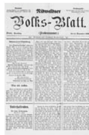
Nidwaldner Volksblatt du 1.12.1866