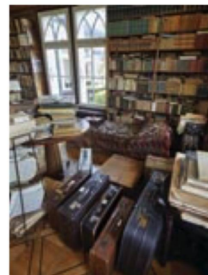
La bibliothèque de Fränkel et les valises contenant le «crypto-fonds» de Spitteler

Le nombre des utilisateurs actifs a enregistré un recul, de 943 (2019) à 829 (2020) personnes (- 12%) en raison des fermetures de salles de lecture pour cause de coronavirus; les renseignements et recherches ont baissé de 17%, de 3949 (2019) à 3257 (2020).