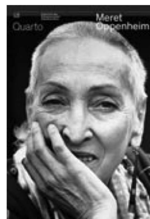
Quarto consacré à Meret Oppenheim