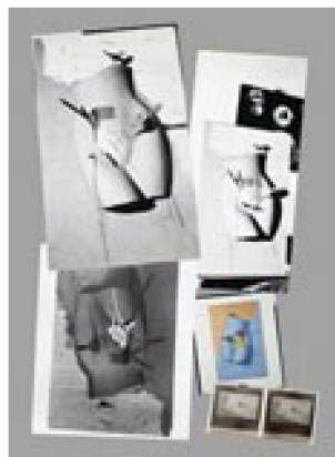
Daniel Spoerri : photographie de l'assemblage Gebauchpinselt tiré de la série Pièges à mots , vers 1966