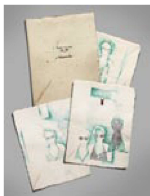
Fiorenza Bassetti : livre d'artiste comprenant 10 aquarelles et une couverture, vers 1980