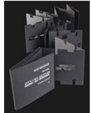
Serge Chamchinov: leporello d'après la nouvelle Dans le tunnel de Friedrich Dürrenmatt, 2021

Avec 775 requêtes, le nombre de demandes d'utilisation a été nettement inférieur à celui de l'année précédente. Elles ont à nouveau concerné pour l'essentiel les collections des Archives fédérales des monuments historiques (230 en 2021, 231 en 2020), de photographies (322 en 2021, 319 en 2020) et des arts graphiques (223 en 2021, 236 en 2020). Le nombre de visiteurs sur place a été légèrement supérieur à celui de l'année précédente, mais toujours nettement plus faible que dans les années antérieures à la pandémie. Les demandes de prêts d'originaux du Cabinet des estampes pour des expositions externes ont par bonheur été nombreuses et les chiffres de l'an dernier ont été dépassés, aussi bien en ce qui concerne le nombre d'expositions qui en ont profité que le nombre des documents prêtés.