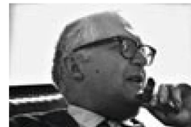
Friedrich Dürrenmatt

La Phonothèque nationale a organisé le Congrès annuel 2021 du groupe de pays Allemagne Suisse de l'Association internationale des archives sonores et audiovisuelles ( International Association of Sound and Audiovisual Archives – IASA ). Celui-ci s'est déroulé en ligne et la Phonothèque nationale en a tiré parti pour présenter l'institution et ses activités à un public spécialisé et pour renforcer ses réseaux. Une centaine de personnes ont participé à ce congrès de deux jours.