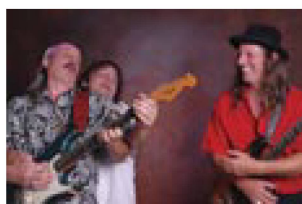
More Experience, le groupe de reprises de Jimi Hendrix