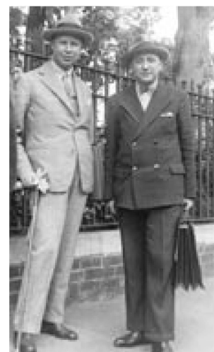
Piero Coppola avec Serge Prokofiev