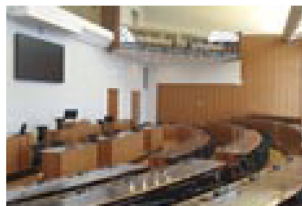
La salle du conseil communal de Lugano (photographie : archives administratives de la Ville de Lugano)

En collaboration avec diverses institutions, la Phonothèque nationale suisse a poursuivi en 2021 son engagement pour la préservation et la mise en valeur du patrimoine sonore de la Suisse. Elle a lancé, avec les archives administratives de la Ville de Lugano et l'association Memoriav, un projet de sauvegarde des enregistrements des séances du législatif de Lugano de 1962 à 2003. Elle a en outre acquis d'importantes collections, en particulier celles du groupe suisse More Experience et du Widder-Bar de Zurich. Elle a de plus produit une phonographie pour le 100 e anniversaire de la naissance de l'écrivain et peintre Friedrich Dürrenmatt.