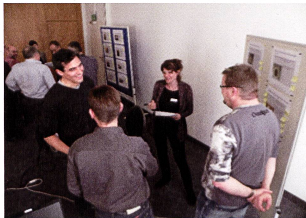
Figure 1: Des représentants d'OrTra formulent des demandes et des souhaits à l'intention de l'OFSP, 13 mars 2015.

L'OFSP a organisé deux journées pour la branche de la construction afin de mettre en œuvre la mesure VI «Formation des professionnels» du Plan d'action radon 2012-2020. La rencontre du 13 mars 2015 était destinée aux responsables des organisations du monde du travail (OrTra). L'OFSP a pu compter sur la participation de représentants de 18 associations professionnelles de la construction, couvrant