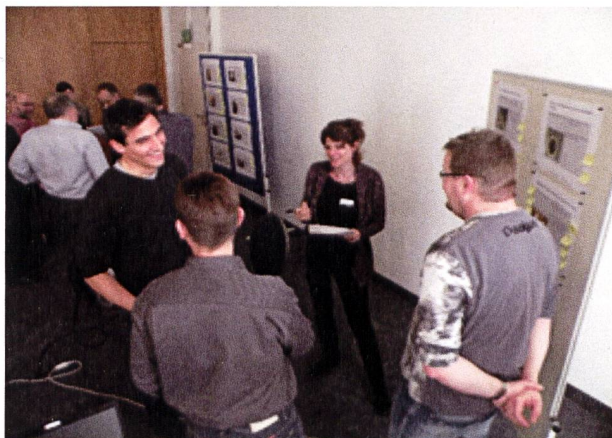
Figur 1: Vertreter formulieren Anliegen und Wünsche ans BAG, 13. März 2015.

Für die Umsetzung der Massnahme 6 «Ausbildung von Baufachleuten» im Radonaktionsplan 2012-2020 hat das BAG zwei Tagungen für das Baugewerbe organisiert. Am 13. März 2015 fand eine Tagung für die Verantwortlichen der Organisationen der Arbeitswelt (OdA) statt. Das BAG konnte Vertreter von 18 Verbänden der Bauberufe begrüßen, die insgesamt 68 Berufsabschlüsse der beruflichen Grundbildung und der höheren Berufsbildung vertraten. Am 6. November 2015 folgte die Tagung für Dozierende im Ingenieur- und Architekturwesen. Die Teilnehmenden vertraten zwei Hoch-