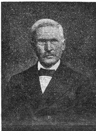
Friedr. Wilh. Raiffeisen 1818—1888.

50 Jahre sind verflossen, seitdem Raiffeisen selbst die erste Zentralorganisation geschaffen, die lokalen Vereinigungen gesammelt und ihnen im Generalverband einen starken Rückhalt gegeben hat. 80 Jahre schon sind verstrichen, seitdem die ersten Raiffeisenvereine das Licht der Welt erblickten. In harter Notzeit, um die Mitte des vorigen Jahrhunderts entstanden, durch entsagungreiche und aufopferungsvolle Arbeit eines ganzen Menschenlebens in beste Form gebracht, haben sie sich, allen Hindernissen zum Trotz, Bahn gebrochen, unendlich viel Not gelindert und die besten Kräfte zu neuer Entfaltung gebracht. Von Deutschlands Gauen ist „das Lied vom braven Mann“, ist der Name „Raiffeisen“ hinausgedrungen in alle Länder Europas, um schließlich auch in überseeischen Ländern, in