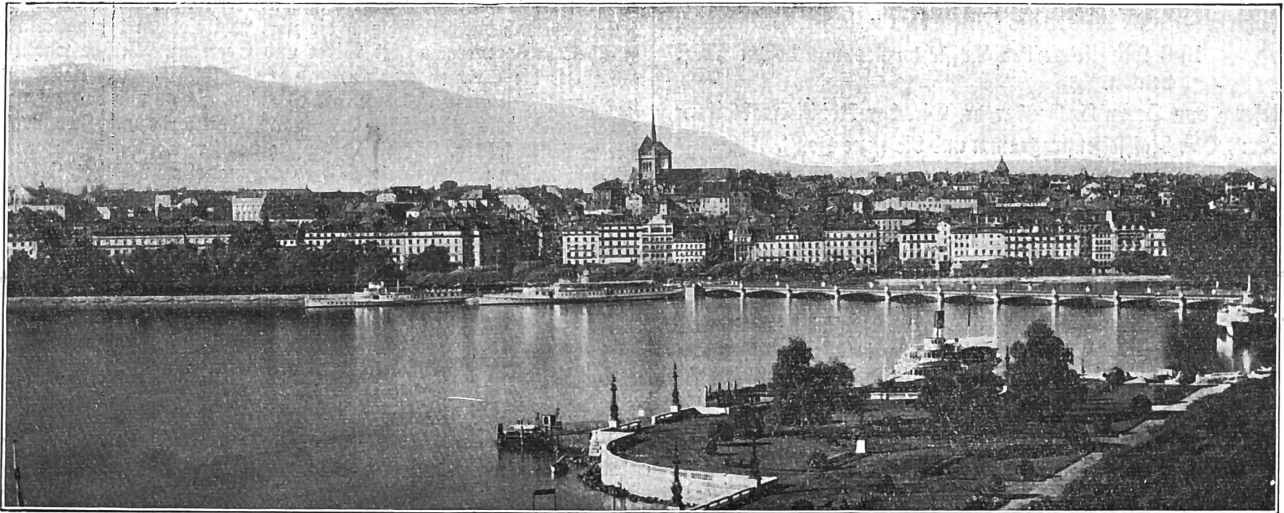
Genf mit Quaianlagen.

gültigem Sonntagsbillet zu reisen und in Lausanne einen Besuch des Comptoir. Suisse, d. h. der alljährlich im September stattfindenden landwirtschaftlichen Mustermesse zu verbinden. Sodann bietet das überaus malerische Gestade des Genfersees zur Herbstzeit einen reizenden Anblick und schließlich ist die heute vom großen Fremdenstrom entblößte schweizerische Grenzstadt Genf besonders glücklich, Mit eidgenossen in ihren Mauern beherbergen zu können. Für die Genfer Raiffeisenfreunde aber naht die längst ersehnte Feierstunde, mit den Raiffeisenmännern jenseits der Saane Fühlung