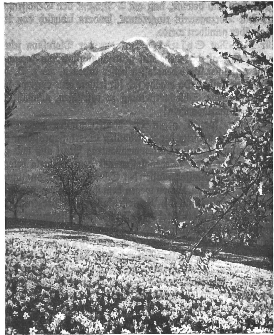
Margisfenfeld ob Montreux.

„Die Darlehenskassen sind nicht Banken und können nie Banken werden. Wollten sie sich zu Banken entwickeln, dann könnten sie nicht mehr Raiffeisenkassen sein. Denn die fundamentalen Grundlagen sind andere und gerade hier will man die Prügel hinwerfen, wenn man sagt, es seien noch keine Fälle der Solidarität bei Raiffeisenkassen bekannt worden. Ist dies nicht ein Beweis dafür, daß gerade die fundamentalen Elemente der Raiffeisenkassen in allen Teilen sich be-