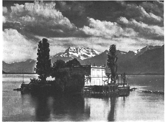
Insel Salagnon bei Clarens.

Die 27 im Verband Schweiz. Kantonalbanken vereinigten Institute haben pro 1943 eine Bilanzzunahme von Fr. 152,5 Mill. oder 1,9% auf 8279,4 Mill. zu verzeichnen. 21 Institute haben Bilanzzunahmen von Fr. 0,8 Mill. (App. S.-Rh.) bis Fr. 41,3 Mill. (Zürich) aufzuweisen, während bei 6 Banken kleine Rückgänge von je weniger als Fr. 10 Mill. eintraten. Die Bilanzzunahme entfällt auf der Passivseite vornehmlich auf die Spareinlagen, die bei allen Verbandsmit-