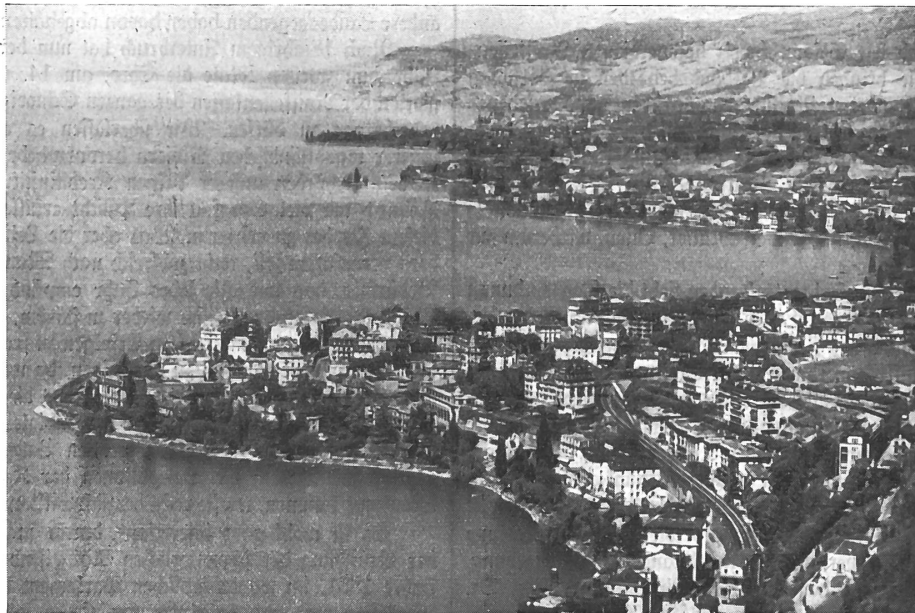
Generalansicht von Montreux.

Kann die diesjährige, 41. Delegiertenversammlung über einen weiteren kräftigen Fortschritt und eine allseits solide Verfassung von Kassen und Verband befinden, über ein Jahr, das Selbsthilfesinn und Selbstvertrauen, aber auch Befähigung zur geldlichen Selbstversorgung und Selbstverwaltung des Dorfes aufs neue bestätigt hat, so gilt es dieses