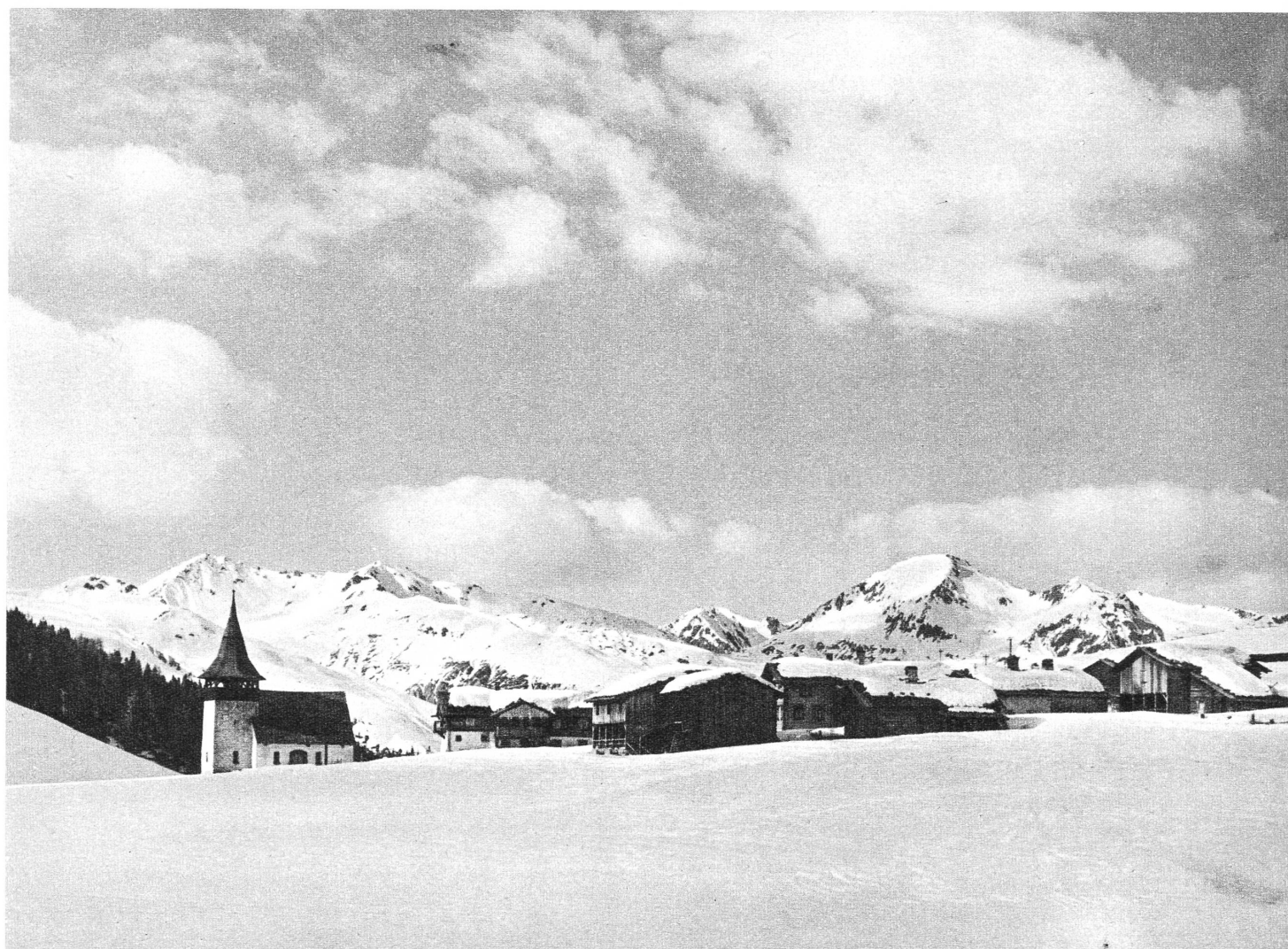
Wintereinsamkeit. Das einsame Sertigdörfli bei Davos