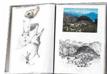
Album di schizzi di Hans Witschi

WITSCHI, Hans, Skizzenbuch 1985–1987 , 1 fascicolo, 1985–1987.