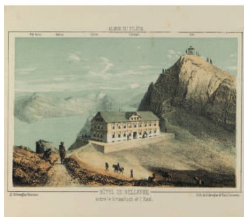
Hôtel Bellevue entre le Kriesiloch et l'Esel, in: Album du Pilâte: collection de 10 vues du Pilâte et de ses environs accompagnée d'un panorama , dess. d'après nature et lith. par Xaver Schwegler, Lucerne: Schwegler & fils, ca. 1865

quali sono state rese accessibili otto testate del diciannovesimo secolo, nonché La Sentinelle (1890–1971) del Cantone di Neuchâtel. Le richieste di ricerca di giornali digitalizzati dalla BN sono più che quintuplicate rispetto all'anno precedente (2013: 15 114; 2014: 83 549) 25 .