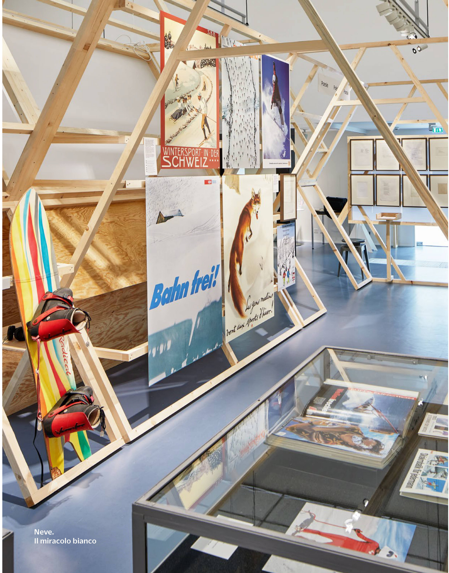
Neve. Il miracolo bianco