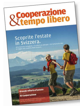
Speciale Estate di ST sul giornale Coop.

In Polonia, il National Geographic Traveler ha pubblicato per la prima volta un numero monografico sulla Svizzera. Questo rinomato periodico di turismo con 480 000 lettori ha dedicato al nostro Paese ben 132 pagine. Esso appartiene alla casa editrice Burda, che in aggiunta ad altri suoi titoli ha diffuso il tema Svizzera in una tiratura di due milioni di copie. La Svizzera è stata protagonista anche su Auto Touring Extra, una rivista dell'Automobil Club austriaco (ÖAMTC). In Austria, ST ha così ottenuto 500 000 contatti mediatici.