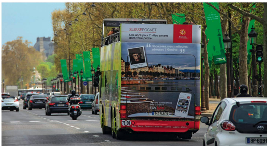
Propaganda di ST sugli autobus di Parigi per l'apprezzata app «SuissePocket».