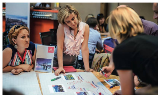
I partecipanti all'evento di networking a Mosca mentre discutono del potenziale della Svizzera per meeting e viaggi incentivi.

Da gennaio 2014, lo SCIB è rappresentato anche a Singapore. Il crescente numero di pernottamenti e il forte potenziale di crescita del Sudest asiatico hanno indotto lo SCIB a puntare su un incremento di meeting e viaggi incentivi da questa regione. SCIB Singapore ha già ricevuto 61 richieste d'offerta che hanno prodotto 18 000 pernottamenti e un fatturato di quasi sei milioni di franchi.