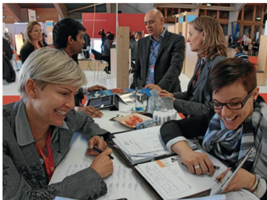
Der erste STM Il primo STMS ha fruttato un supplemento di 125 000 pernottamenti.

ST e il grande magazzino di lusso Jelmoli di Zurigo hanno celebrato l'inverno con una promozione speciale di tre settimane e un esclusivo evento serale. L'iniziativa ha coinvolto numerosi partner di ST che hanno presentato la loro regione ai visitatori. Per l'occasione ST ha distribuito 13 300 opuscoli e 20 000 set di cartoline. Jelmoli ha dato risalto all'anniversario anche nella propria rivista invernale stampata in 124 000 copie che ha raggiunto 310 000 lettori. Nelle tre settimane Jelmoli ha accolto 400 000 clienti.