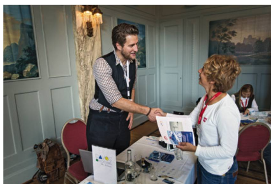
Workshop sull'inverno al Teatro Reale dell'Aja.

Warren Miller, il leggendario regista e produttore californiano di spettacolari film su sci e snowboard, mostra nella sua ultima opera «No Turning Back» sensazionali immagini della Svizzera. Con la mediazione di ST, i paesaggi svizzeri e i partner SWISS e Mammut occupano dieci su novanta minuti del film. Marketing integrato e proiezioni cinematografiche con circa 150 000 spettatori hanno consentito a ST di consolidare negli Stati Uniti l'immagine della Svizzera come privilegiata meta invernale.