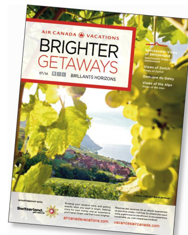
I vigneti del Lavaux (VD): la copertina della rivista di bordo di Air Canada.

I passeggeri di Air Canada che hanno sfogliato la rivista «Brighter Getaways» o assistito all'intrattenimento di bordo, da sopra le nuvole hanno ammirato i più affascinanti panorami della Svizzera. ST ha pubblicizzato le sue proposte in una campagna di marketing integrato che ha fruttato 1,7 milioni di contatti con il network internazionale della flotta di Air Canada.