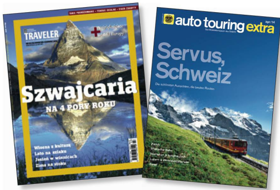
In stretta collaborazione con ST: rivista monografica sulla Svizzera realizzata in Polonia e Austria.

In maggio, il noto chef Juna della TV indonesiana ha compiuto un viaggio in Svizzera preparando una serie di piatti locali svizzeri per il suo show «Arjuna» su Global TV. ST ha così coinvolto per la prima volta una rete televisiva indonesiana in un grande progetto turistico. L'équipe di Juna ha girato in Svizzera 28 episodi che hanno raggiunto otto milioni di spettatori.