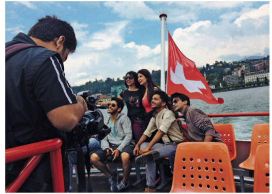
In viaggio: lo «Swiss Made Challenge» ha avuto successo in India.

Per illustrare i vantaggi offerti dalla Svizzera come meta di congressi, ST Polonia in collaborazione con lo SCIB e la Polish Association of MICE Organizers, ha invitato cinque partner e circa 28 partecipanti del settore MICE a un workshop tenutosi a Varsavia. Il workshop, alla sua prima edizione, ha incontrato una forte domanda: ST ha venduto circa 1000 pernottamenti alberghieri in più.