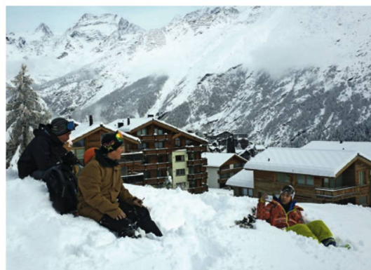
La Corea vede la Svizzera come il paradiso dello snowboard.

Donnaventura è un popolare programma TV italiano, in cui delle giovani reporter viaggiano per il mondo. ST ha realizzato con Donnaventura un progetto marketing di sei mesi, accompagnato da una forte presenza su organi d'informazione e social media. ST ha accompagnato un'équipe di reporter nelle loro riprese in Svizzera, dove sono stati girati due epi-sodi. ST ha realizzato 14,6 milioni di contatti mediatici e online.