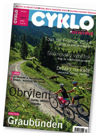
La rivista ceca «Cykloturistika» ha attirato i biker sulle montagne svizzere.

Un'ora di gioia per gli occhi e di Swissness con le Ferrovie Svizzere: è ciò che offre un documentario di alta qualità, prodotto per la televisione pubblica statunitense, dedicato a treni panoramici, ferrovie storiche e vedute mozzafiato. In collaborazione con STS, Rail Europe e una società di produzione televisiva, ST ha realizzato il film «Real Rail Adventures: Switzerland». La trasmissione è stata seguita da circa 12 milioni di telespettatori.