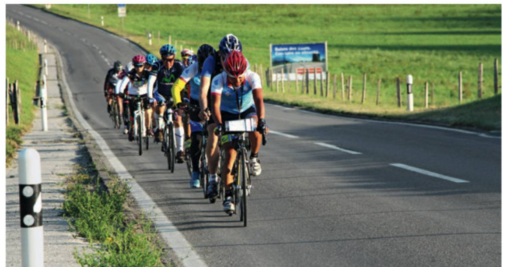
A Hong Kong si sta scoprendo la bicicletta... e la Svizzera.

Avventurosi, di bella presenza, divertenti: sono i sette vincitori, qualificatisi tra 76000 candidati, della gara indetta dal canale lifestyle indiano NDTV Good Times per partecipare al reality show «Swiss Made Challenge». Il loro viaggio, comprensivo di bungee jumping, costruzione di zattere e discesa con la corda in un crepaccio, è stato organizzato da ST. 410 milioni di spettatori hanno seguito l'avventura, mentre su Twitter si sono contate 372000 interazioni e su Facebook oltre 1,2 milioni.