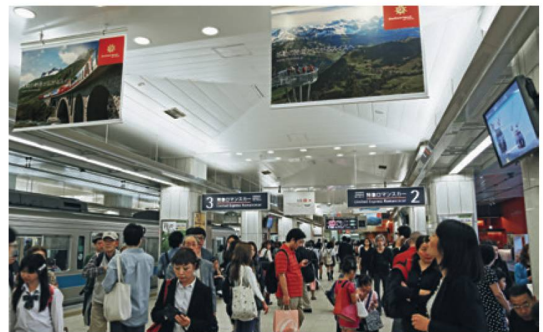
Cartelloni di ST nella stazione ferroviaria di Shinjuku, inclusa nel Guinness dei primati per il maggior numero di passeggeri al mondo.

Su settanta pagine, il supplemento estivo realizzato da Coop e ST ha offerto 75 proposte di alloggi distribuiti in tutte le regioni alpine e rurali della Svizzera e corredate da consigli di esperti. Coop si è dimostrata un partner ideale: con una tiratura di 2,7 milioni di copie e 3,6 milioni di lettori, il giornale della Coop raggiunge quasi i due terzi delle famiglie svizzere. Con questo supplemento estivo ST ha generato oltre 18 000 pernottamenti, 6000 in più rispetto all'anno precedente.