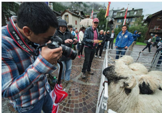
Ambasciatrici lanose: le pecore dal naso nero di Zermatt.