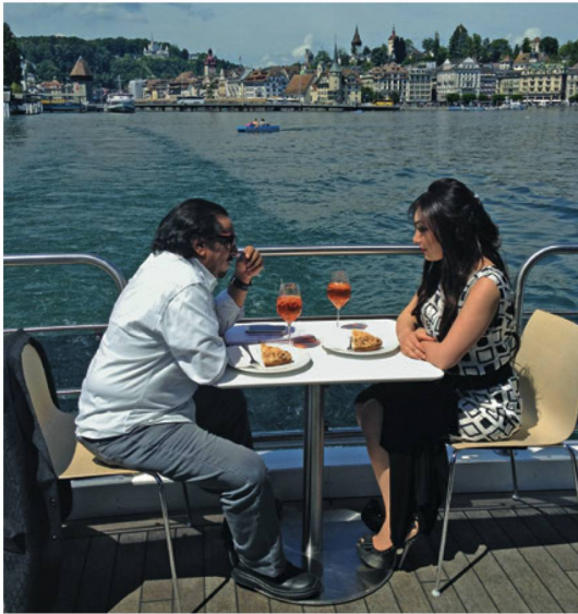
Ottima pubblicità per la Svizzera: star della TV araba a Lucerna.