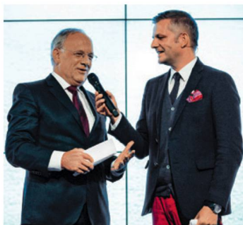
Il consigliere federale Johann Schneider-Ammann all'evento VIP presso lo Jelmoli.