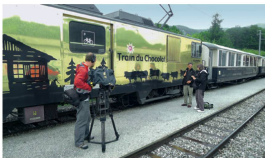
Esperienze su rotaia: in Svizzera, il Paese dei treni.

Scoprire la Svizzera e al tempo stesso tutelare l'ambiente: è l'invito che nasce da una nuova cooperazione tra ST e WWF Svizzera. In questo ambito sono state presentate circa 200 idee per soggiorni ed escursioni all'insegna della natura che sul sito MySwitzerland.com/ecoturismo hanno registrato 60.000 visualizzazioni. Vi sono compresi dieci consigli di viaggio rispondenti alle esigenze di un turismo sostenibile, che WWF Svizzera ha fatto propri per la sua iniziativa «Restiamo Qui», una campagna che invita gli svizzeri a trascorrere le vacanze nel proprio Paese.