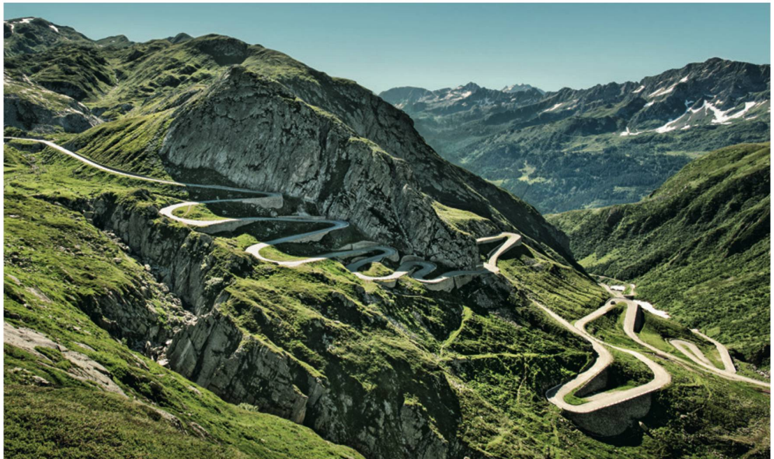
Il «Grand Tour of Switzerland» misce in oltre 1600 km la ricchezza di contrasti della Svizzera, rendendola quasi prenotabile.