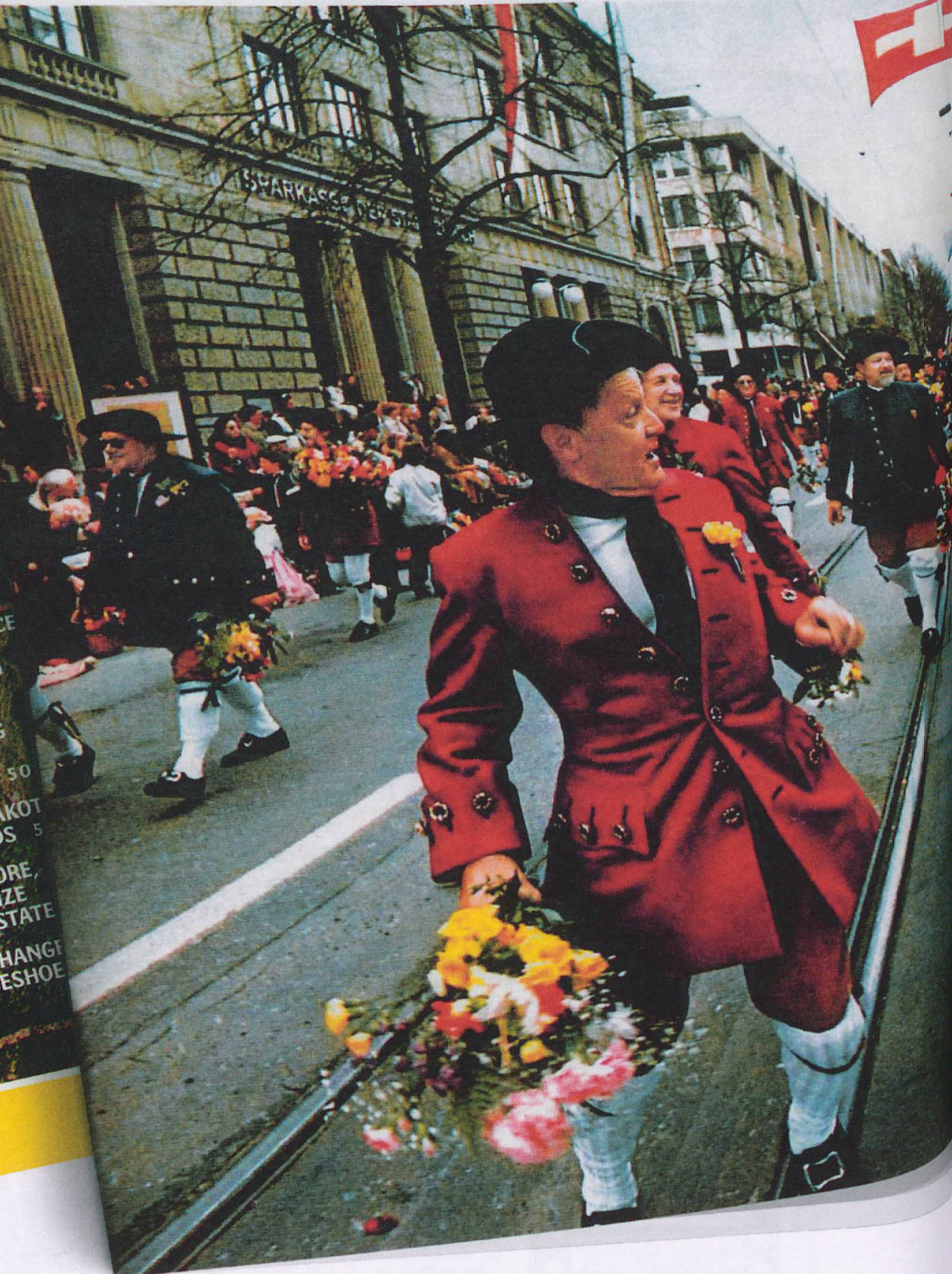
Il risultato di un lavoro mediatico a lungo termine: il «National Geographic» pubblica un allegato di presentazione della Svizzera come destinazione turistica.