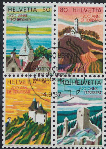
Nel quadro della collaborazione con le allora PTT, negli anni Ottanta l'UNST festeggia con francobolli speciali i primi 200 anni di turismo in Svizzera.