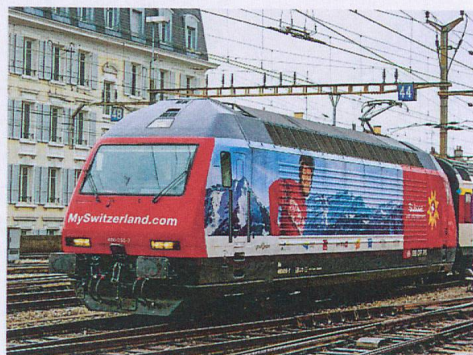
Partneriati strategici: sfruttare le sinergie per esportare insieme l'immagine della Svizzera nel mondo.