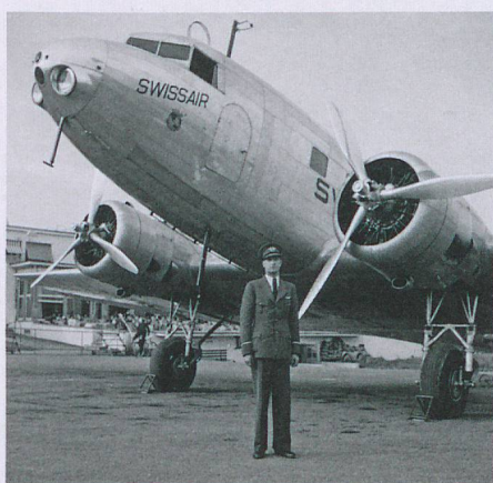
Fondazione della Swissair: per l'UNST sarà un attore importante della promozione nazionale.

L'uso virtuoso della fotografia diventa il marchio distintivo della promozione turistica svizzera attraverso vari periodi. Una delle migliori firme sarà quella di Philipp Giegel (1927-1997), le cui immagini per mezzo secolo scriveranno la storia dell'Ufficio nazionale svizzero del turismo. Anche Yann-Arthus Bertrand, regista del blockbuster «HOME», opera nelle più alte sfere. Nel 2014 il francese raccoglie con il suo obiettivo delle vedute a 360 gradi della «Svizzera vista dal cielo». L'omonimo cortometraggio, della durata di 20 minuti, farà il giro del mondo incantando gli spettatori a bordo dei voli di lungo raggio della SWISS.