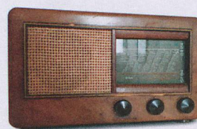
Inizio della «propaganda radiofonica». La pubblicità a pagamento è proibita, e la portata delle emittenti radiofoniche svizzere piuttosto limitata. L'UNST propone «trasmissioni di qualità» al posto della pubblicità e si occupa delle comunicazioni sul traffico.