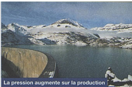
La pression augmente sur la production énergétique des CFF – pas seulement pour l'énergie hydraulique.