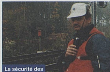
La sécurité des chantiers est très exigeante.