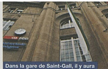
Dans la gare de Saint-Gall, il y aura désormais beaucoup à apprendre.

Ces projets sont de nature très différente. Ils ont ceci en commun que, avec des technologies nouvelles, ils tendent vers une productivité plus élevée à des coûts plus bas avec une qualité meilleure.