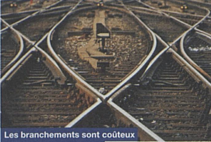
Les branchements sont coûteux à l'achat et à l'entretien.

Les travaux de démontage ont débuté, et le programme prévu est déjà réalisé à raison de 31%. A l'origine, la stratégie devait être d'enlever les installations uniquement à l'occasion de travaux de renouvellement; elle a été revue. Le projet «Infrastructure svelte» a en effet été retenu pour être l'un des grands projets stratégiques qui concernent l'ensemble de l'entreprise et sa réalisation a été accélérée. D'ici à 2005, les désinvestissements auront été achevés, pour permettre une réduction durable des coûts d'exploitation et de maintenance de l'infrastructure.