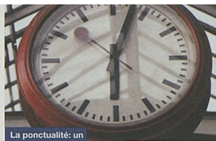
La ponctualité: un objectif primordial des CFF.

La vente de sillons aux clients à l'intérieur et à l'extérieur des CFF est une tâche nouvelle de l'infrastructure CFF. Depuis le 1 er janvier 1999, l'accès au réseau en Suisse est, en trafic marchandises et dans certains secteurs du trafic voyageurs, ouvert à des tiers ( open access ). Moyennant une redevance d'utilisation des sillons, les CFF accordent cet accès aux entreprises ferroviaires habilitées, aux mêmes conditions qu'à leurs propres trafics. Le point de vente travaille pour ses résultats et doit appliquer le principe de la non-discrimination, ainsi que les dispositions de l'ordonnance sur l'accès au réseau ferroviaire. Recours peut être déposé contre les décisions d'adjudication des sillons auprès d'un organe de recours indépendant, mis en place par le Conseil fédéral.