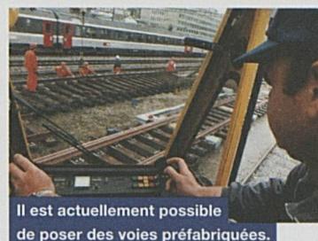
Il est actuellement possible de poser des voies préfabriquées.

Les audits pour les marchandises dangereuses ont été presque aussi nombreux: 41. Ils se sont intéressés en particulier au respect des prescriptions de la part tant du chemin de fer que des expéditeurs. Le taux des réclamations a enregistré une nouvelle baisse, réjouissante.