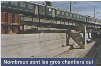
Nombreux sont les gros chantiers qui préparent le chemin de fer de demain.