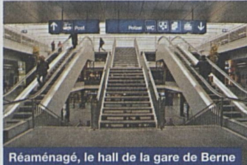
Réaménagé, le hall de la gare de Berne s'est fait plus spacieux.

Le projet «avec.» représente un créneau prometteur pour l'unité d'affaires Domaine, puisqu'il doit permettre non seulement d'accroître les produits réalisés avec les biens-fonds CFF, mais aussi de répondre à une préoccupation du trafic voyageurs concernant de nouvelles formes de présence. Il s'agit d'une joint-venture des partenaires Migros, Kiosk AG et CFF, dont chacun a apporté au projet l'expérience de son activité. La formule «avec.» consiste en un centre de services aménagé sur un espace restreint, avec bar à café, kiosque, denrées alimentaires, vente de billets et facilités de communication, qui est géré par un commerçant indépendant sous contrat de franchisage. Après le succès rencontré par les premiers magasins «avec.» de Schüpfen, Brügg et Mettmenstetten, une cinquantaine d'autres magasins «avec.» sont prévus dans les années à venir.