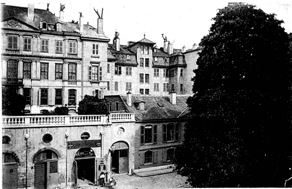
Négatif de M. H. SILVESTRE, prof. Genève.

RAUSER & C e , Coulouvrenière. E. NYDEGGER, rue du Rhône, 410.