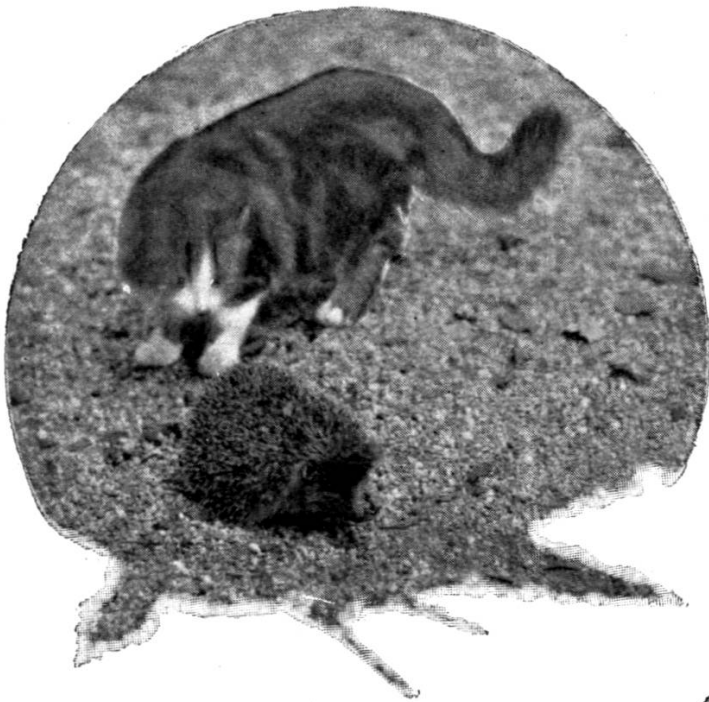
II. A unsolicited visit.