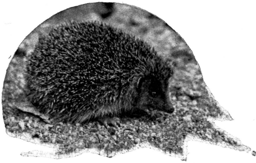
I. A Solitar.