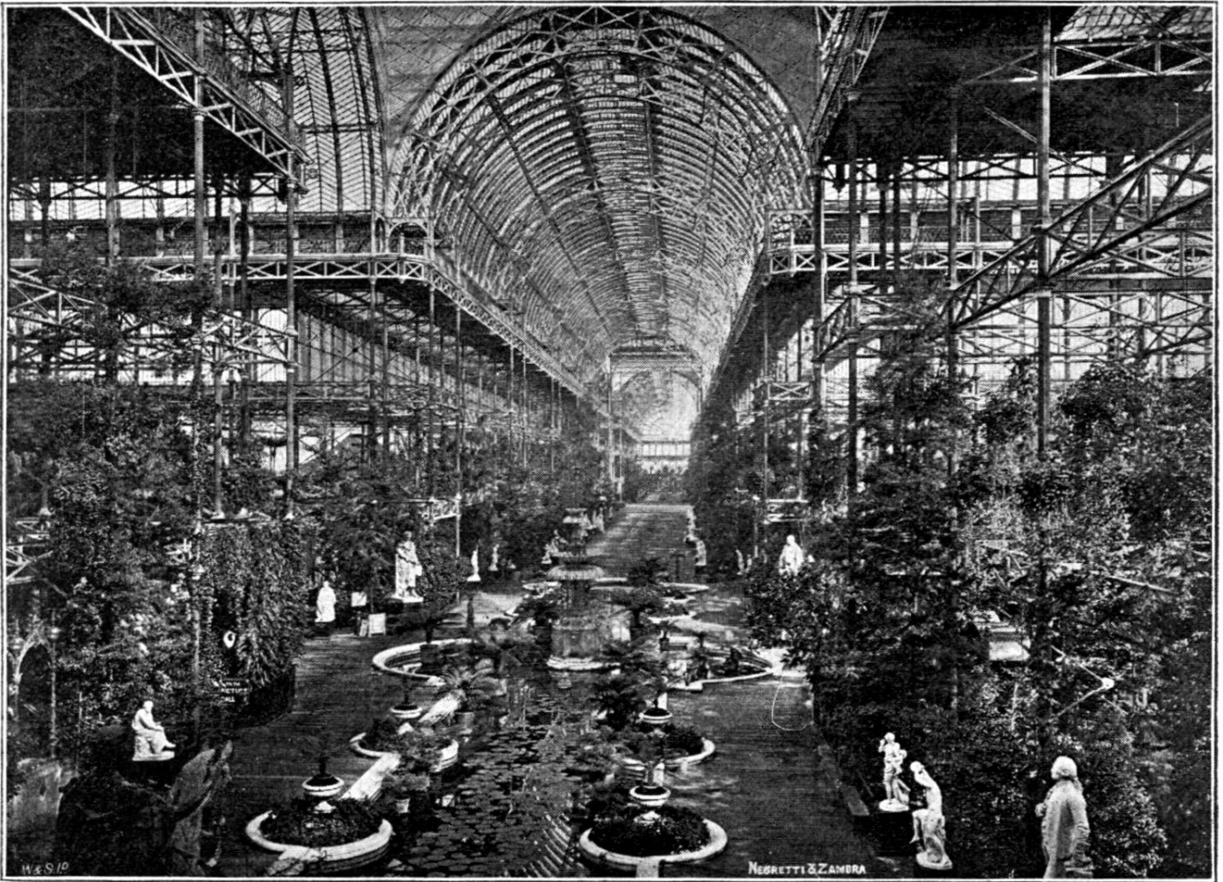
Phototype Negretti et Zambra.

Tous les exposants des Sections 3, 4 et 5, ainsi que ceux des autres sections] qui n'auront pas été invités d'une manière spécifique par le Comité à prêter des objets pour exposer, devront payer comme suit :