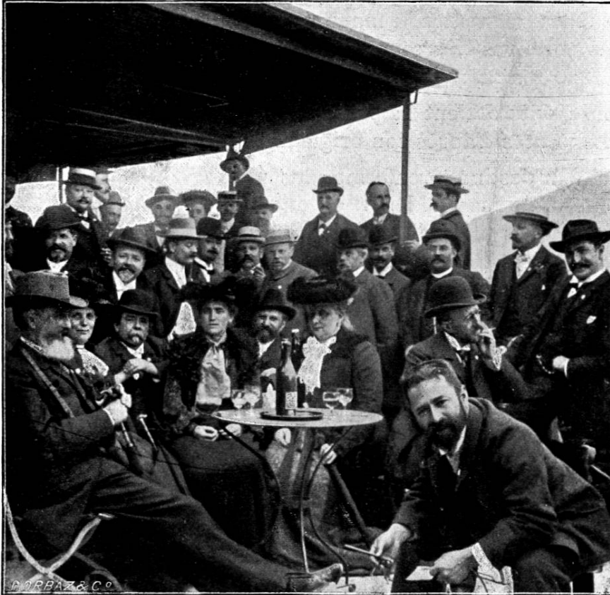
A la Heimwehfluh.

Développement et préparation des négatifs pour la retouche.