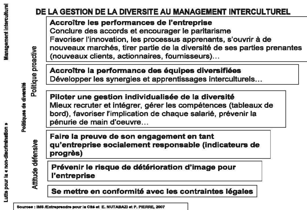
Schéma : De la gestion de la diversité au management interculturel

L'analyse locale des cultures n'est pas suffisante pour comprendre, par exemple, l'entreprise mondialisée. Celle doit prendre en compte les logiques de flux, d'enchevêtrement des identités culturelles. Que fait-on quand l'exception, celle des cadres internationaux, ne confirme pas la règle culturelle (leur appartenance nationale) et qui devrait, en toute logique, expliquer ou permettre de prédire leurs attitudes et comportements au travail ? Le management interculturel, dans son ambition, n'est pas un « contrôle » d'identité en donnant un avantage concurrentiel à un critère d'appartenance à un groupe plutôt qu'un autre. Il est une politique qui permet de construire les conditions d'accès à la reconnaissance en entreprise.