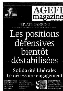
6 parutions Kiosque / Abonnement