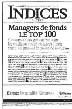
Mensuel Encarté dans L'Agefi