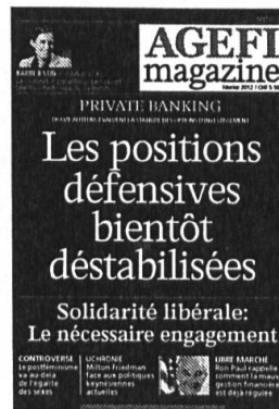
6 parutions Kiosque / Abonnement