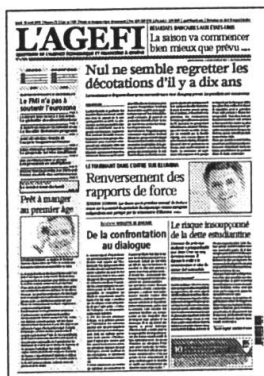
Lu - Ve Kiosque / Abonnement

Retrouvez l'intégralité de nos contenus sur www.agefi.com