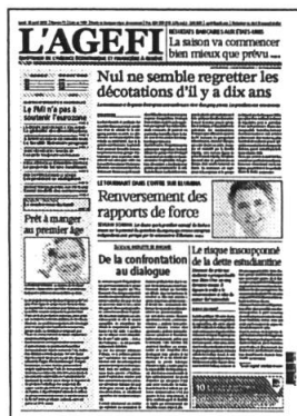
Lu - Ve Kiosque / Abonnement

Retrouvez l'intégralité de nos contenus sur www.agefi.com