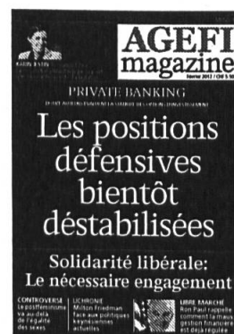
6 parutions Kiosque / Abonnement