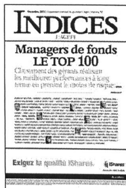
Mensuel Encarté dans L'Agefi