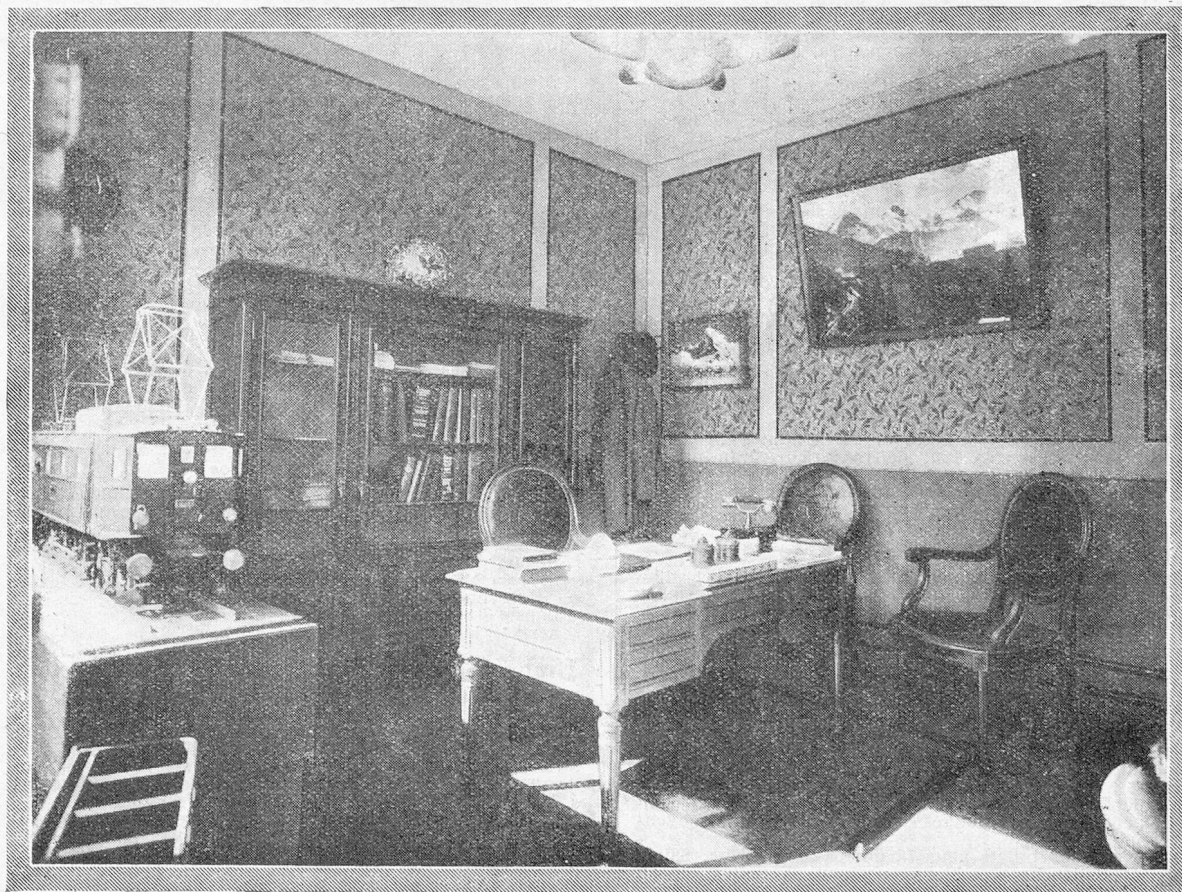
Un coin du bureau officiel suisse de renseignements à la Foire de Lyon, 1927

à Paris : Chambre de Commerce suisse en France.