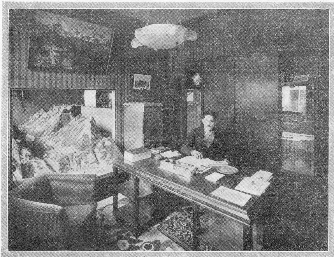
Le Bureau officiel suisse de renseignements à la Foire de Lyon.

Un déjeuner mensuel qui a lieu le premier samedi de chaque mois, à 12 h. 30, au Café Neuf, place Bellecour, réunit les membres de la section lyonnaise de la Chambre de Commerce suisse en France. Tous les membres et amis de notre Chambre de Commerce qui se trouveraient de passage à Lyon, le premier samedi du mois, sont cordialement invités à participer à ce déjeuner.