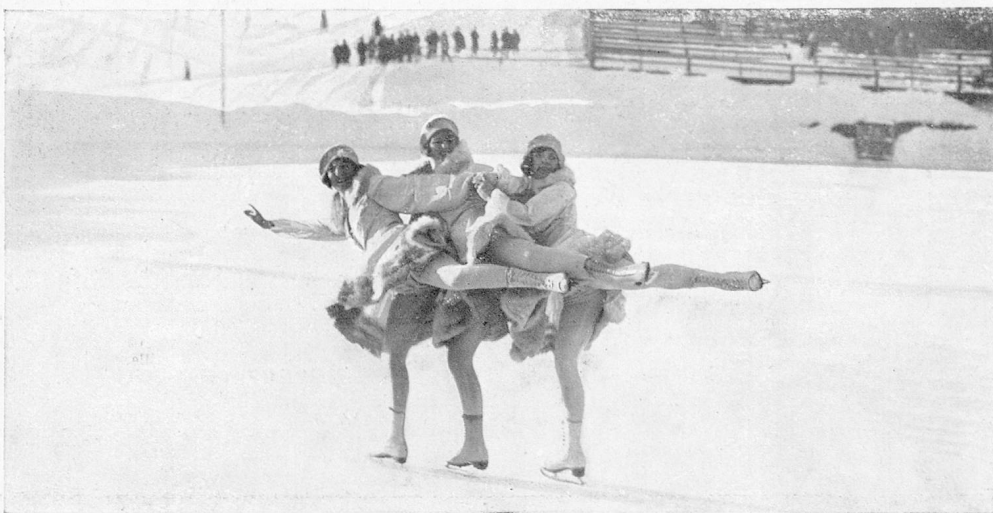
Patineuses à Saint-Moritz

Les adeptes des sports d'hiver n'ont donc que l'embarras du choix. De quelque côté qu'ils se dirigent en Suisse, ils sont sûrs de trouver durant la saison froide des installations sportives répondant à leurs goûts, des hôtels confortablement aménagés, puis la neige et la glace, conditions premières des sports, enfin l'air pur, le soleil resplendissant, les cirques de haute montagne, les panoramas éblouissants. En faut-il davantage pour que les montagnes de la Suisse attirent d'année en année, en nombre toujours croissant, ceux qui sentent le besoin d'abandonner les préoccupations absorbantes de la ville, l'atmosphère fumeuse et poussiéreuse des grands centres, l'humidité et les brouillards de la plaine pour se retremper à la montagne, au milieu de paysages ensoleillés et d'une nature idéalement belle!