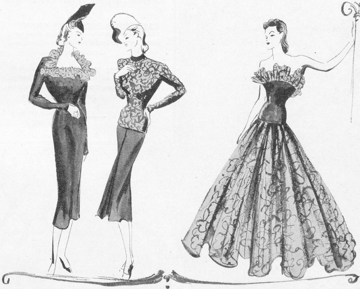
Créations de la Maison Robert Piguet

Les organdis et les linons brodés en formes