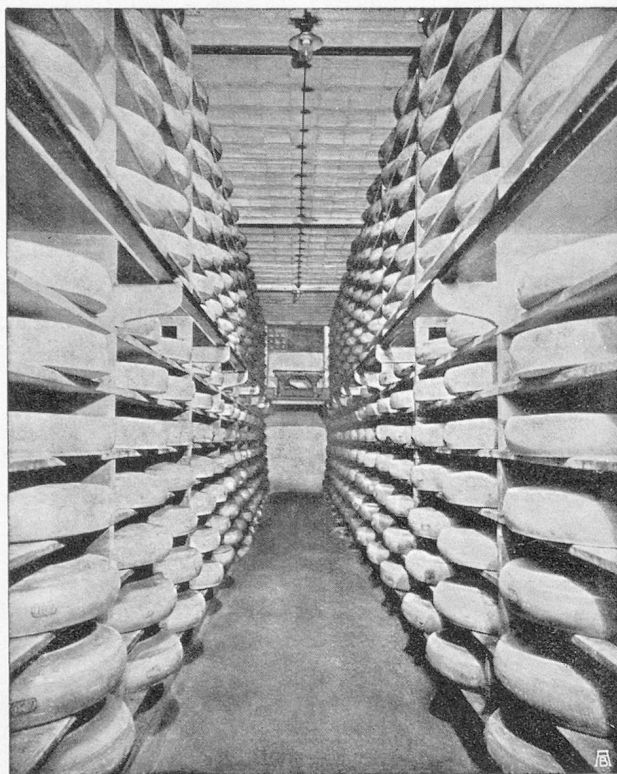
Une cave à « Emmental »

Vice-Président de la Chambre de Commerce Suisse en France.