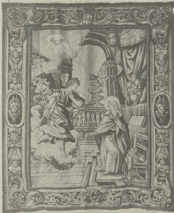
L'annonciation. Tapisserie flamande. Eglise Saint-Just, xvii e siècle

Les particularités techniques n'expliquent pas à elles seules les bonnes ou mauvaises époques d'un