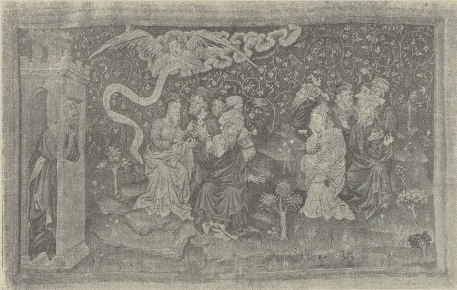
L'apocalypse. Paris, fin XIV e siècle Saint Jean aperçoit les Sages qui cherchent le nombre de la Bête. (Angers, Musée des Tapisseries.)