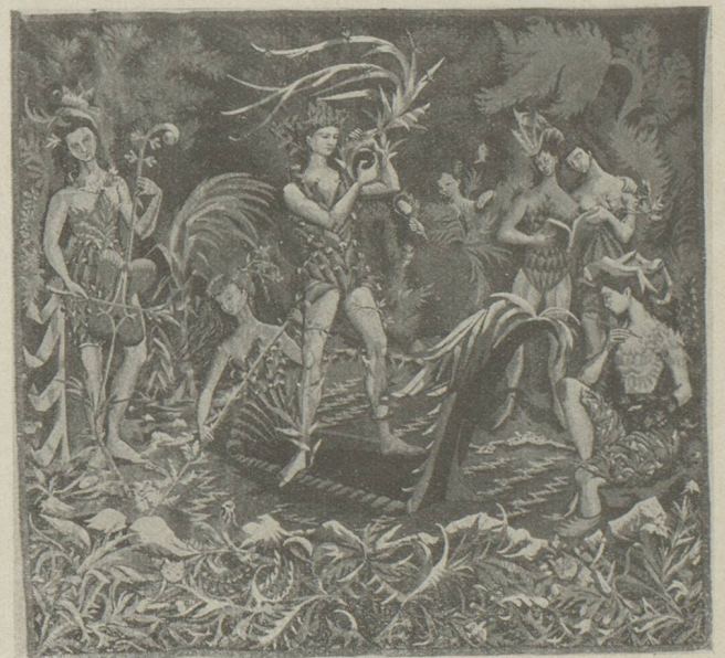
Orphée et les Muses. Tapisserie d'Aubusson de Coutaud. (Edition de la Compagnie des Arts français.)