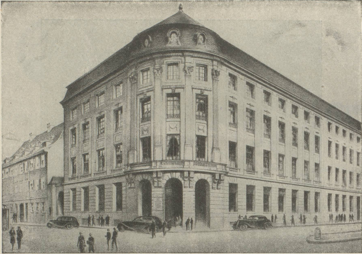
HOTEL DE LA BANQUE A BALE