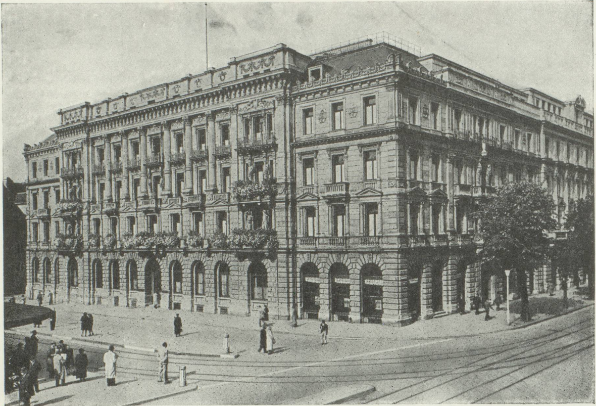
Hôtel de la Banque à Zurich