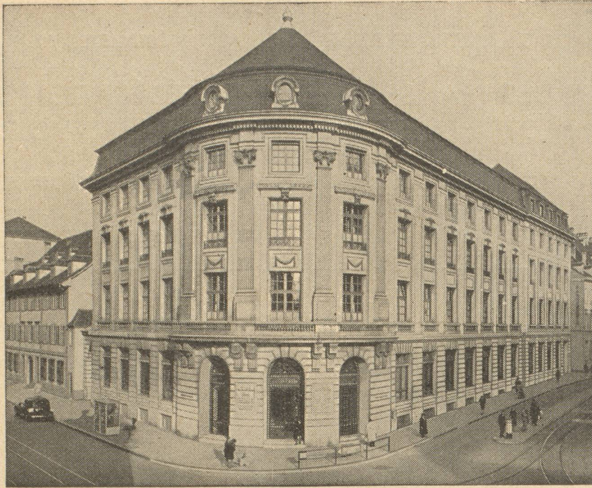
HOTEL DE LA BANQUE A BALE