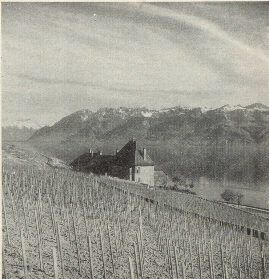
Lutry : lac Léman

IL est commun de dire que la Suisse est comme une petite Europe, ou plutôt comme une Europe en petit. Et c'est parce qu'elle est composée de quelque vingt-cinq Etats ayant chacun son gouvernement, qu'on y parle quatre langues dites nationales ce qui n'est qu'approximativement vrai, car trois au moins de ces langues portent le nom des peuples qui entourent la Suisse, le Français (à tout seigneur, tout honneur), l'Allemand et l'Italien, chez qui elles sont proprement nationales, comme seul peut l'être chez nous le romanche parlé par quelques dizaines de milliers de montagnards des Grisons — et que les confessions et dénominations chrétiennes les plus diverses y ont droit de cité. C'est ce qui a permis de dire à Gonzague de Reynold que la Suisse était diverse dans son unité. Ce qui est incontestablement une richesse pour un peuple fort.