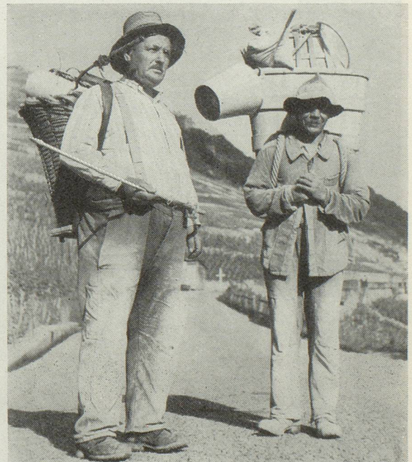
Types de vigneron valaisans