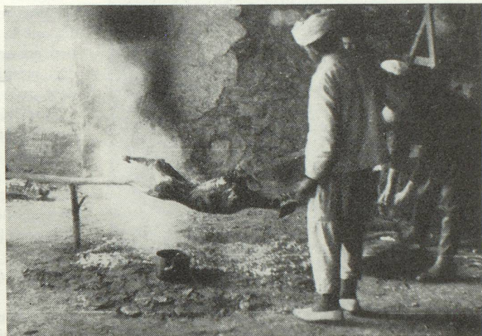
« Puis venaient les moutons embrochés et rôtis dans un enclos voisin. D'abord un ou deux moutons rôtis entiers : on les apporte empalés sur de longues broches et tout frissonnants de graisse brûlante »