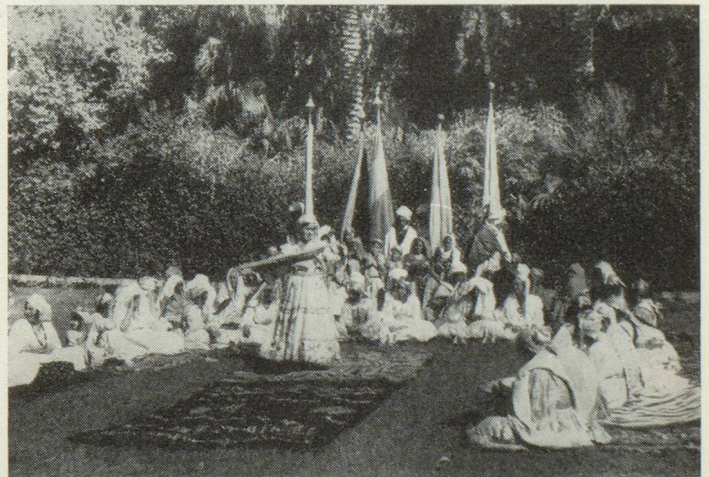
« Puis au dessert, tandis que défile une variété infinie de pâtisserie orientale, les danseuses arabes commencent leurs ébats chorégraphiques au son des raïtas et de la derbouka »