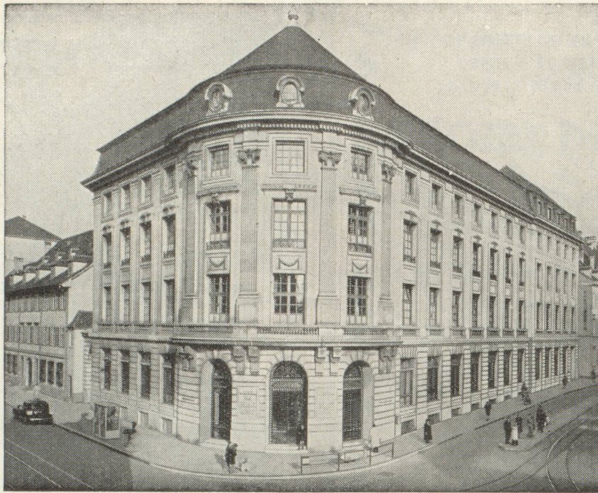
HOTEL DE LA BANQUE A BALE