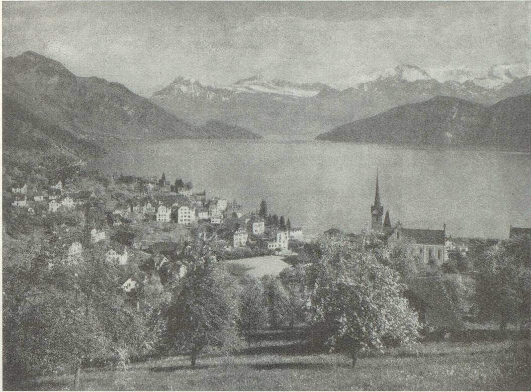
Weggis, au bord du lac des Quatre-Cantons