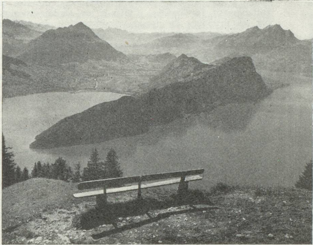
Le lac des Quatre-Cantons