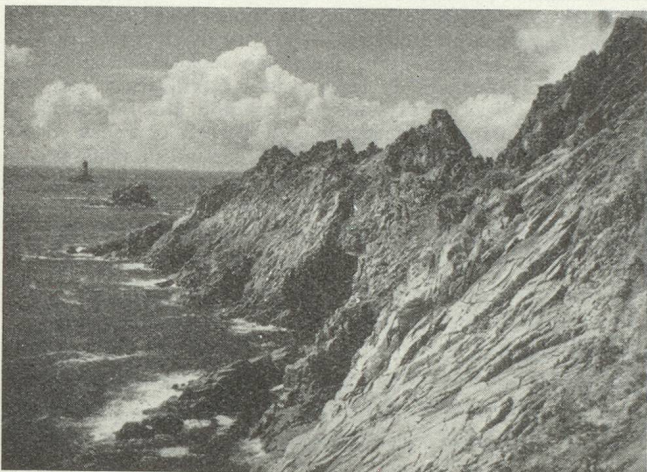
Les récifs granitiques de la Pointe du Raz, avancée de la presqu'île bretonne, avec les phares de La Vieille, et vers le large, d'Ar-Men

Dans la région de Grenoble, en Savoie et Haute-Savoie, le nombre des touristes suisses a augmenté en raison de