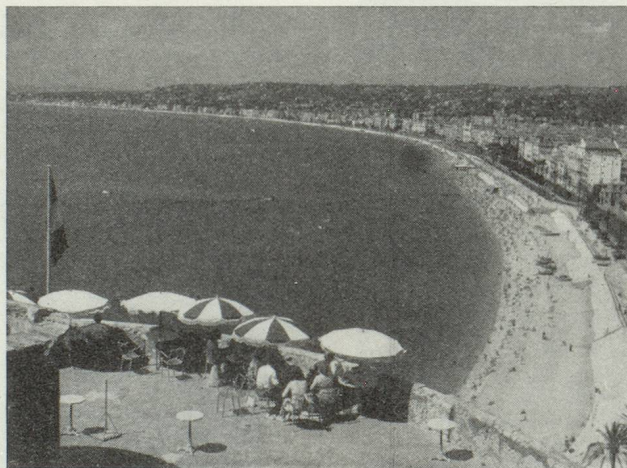
C'est la royauté du soleil sur l'intense azur, Nice la Belle, immensité de lumière sur l'immensité des flots calmes